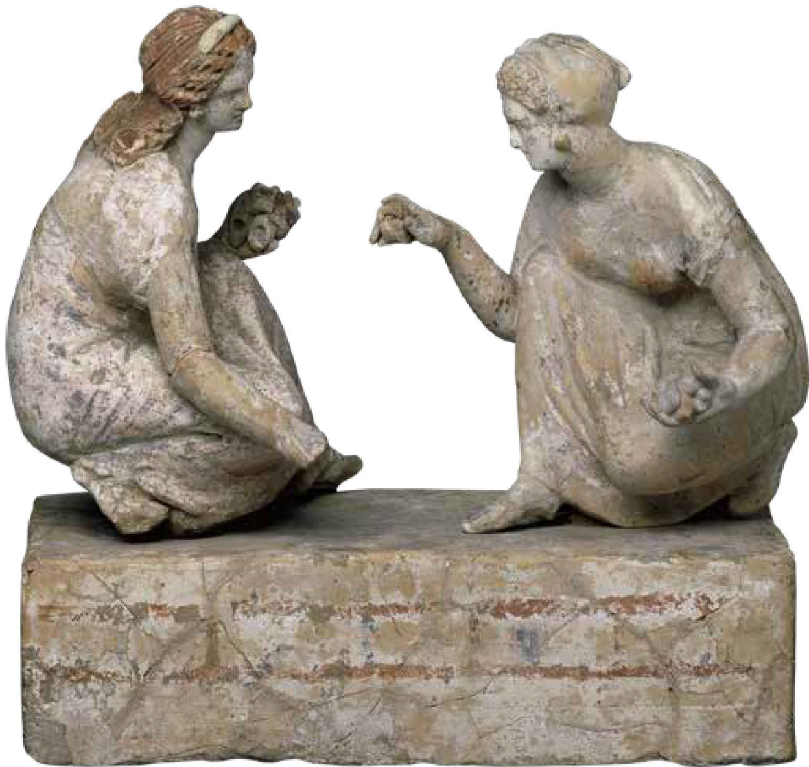
Πήλινα αγαλματίδια γυναικών που παίζουν αστραγάλους, 340-330 π.Χ. Βρετανικό Μουσείο, Λονδίνο