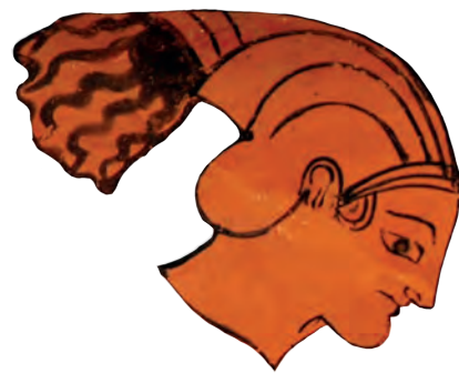
23. Λεπτομέρειες από ερυθρόμορφα αγγεία που απεικονίζουν άνδρες και γυναίκες με ταινίες στα μαλλιά και γυναίκες που φορούν διαφορετικούς τύπους σάκκων.