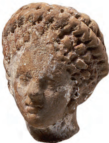
21. Κεφαλή γυναικείου ειδωλίου, 4 ο -2 ο αι. π.Χ.

Οι άνδρες είχαν τα μαλλιά τους κοντά ή μακριά, ανάλογα με την ηλικία. Σε διάφορες περιστάσεις, συμπόσια, αθλητικούς αγώνες και τελετές, φορούσαν στα μαλλιά πορφυρές ταινίες ή στεφάνια.