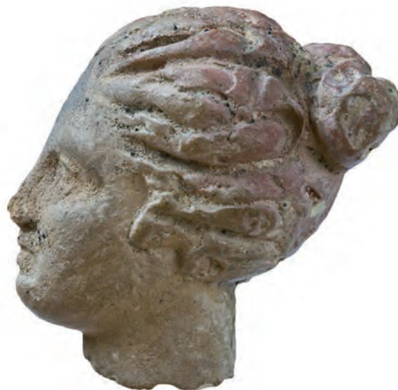
22. Κεφαλή γυναικείου ειδωλίου, τέλη 4 ου -3 ου αι. π.Χ.