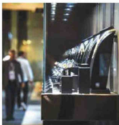
Alcune immagini delle fiere di settembre