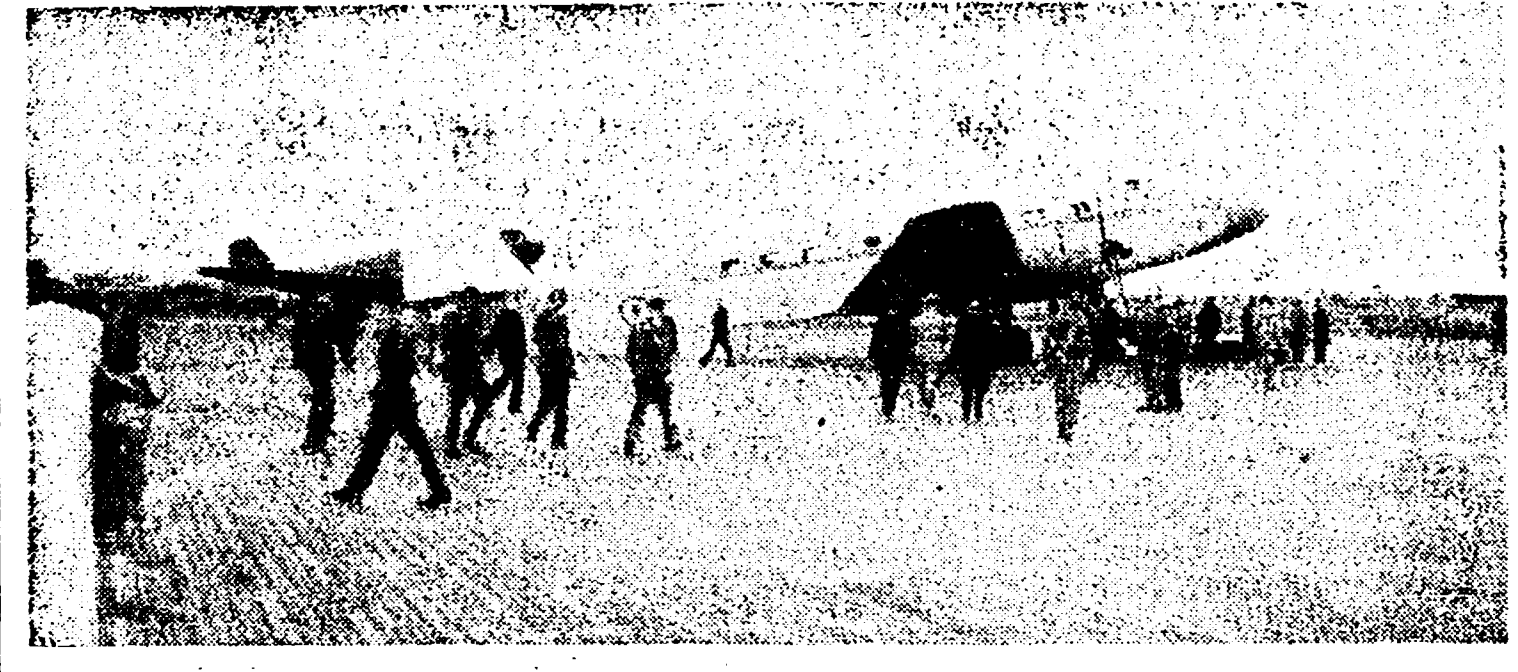
CIAMPINO, ore 16,05: Umberto Savoia sul punto di salire sull'aereo

Di conseguenza domani i ministri comunisti chiederanno l'immediata convocazione del Consiglio dei Ministri. Roma, 13 Giugno 1946 LA SEGRETERIA DEL P. C. I.