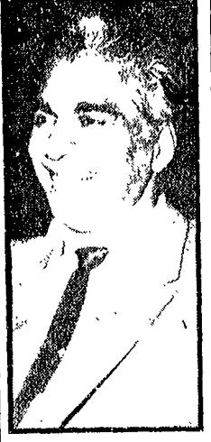
Cheddi Jagan, leader della opposizione di sinistra nella Guyana ex britannica, sarebbe stato arrestato in questi giorni.