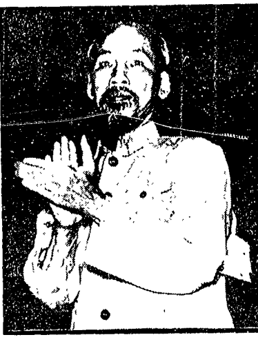
Ho Chi Minh, presidente della Repubblica democratica del Vietnam.

PARIGI, 2. I «numeri due» delle delegazioni americana e nordvietnamita Cyrus Vance e Hanoi Lo, si sono incontrati quest'oggi per discutere — afferma una notizia di fonte americana — le modalità preliminari di pace a Parigi. Per i nordvietnamiti l'incontro invece è servito al colonnello Hanoi Lo a presentare alla parte americana una lista di proteste contro i ripetuti atti di guerra che gli Stati Uniti continuano a commettere a danno della Repubblica democratica vietnamita. Comunque sia andato l'incontro, la conferenza di pace potrebbe aprirsi di qui a una settimana, cioè tra il 9 e il 14 dicembre: prima è ormai indispensabile, anche se molti lo pensavano, perché da una parte la delegazione sudvietnamita arriverà a Parigi soltanto tra tre o quattro giorni, e dall'altra il capo della delegazione americana Hanoi Lo è partito ieri alla volta di Washington dove dovrebbe restare circa una settimana.