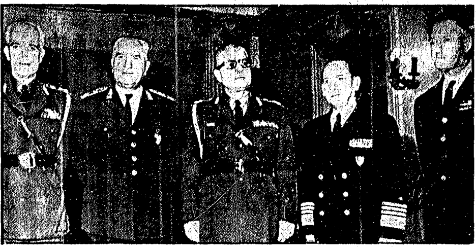
GENERALE ITALIANO E COLONNELLI GRECI L'ultimo a destra nella foto è il generale italiano Angelo, al centro il colonnello turco Cemal Tural, al « reggente » Zoltakis e all'ammiraglio americano Rivero, al recente convegno NATO di Atene, durante il quale italiani e turchi, insieme ai colonnelli fascisti greci, hanno tenuto a battesimo il « settore sud » dell'alleanza atlantica. E' così che, mentre l'Italia non ha neppure un governo, mentre la richiesta di dislocare il nostro paese dalla vergognosa convivenza in un'alleanza militare con il regime fascista greco viene avanzata anche dai socialisti e dalla sinistra dc, vengono in realtà rafforzati i legami politici proprio con le forze più reazionarie rappresentate all'interno della NATO