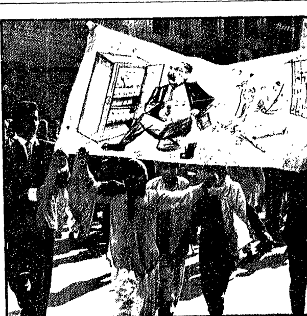
NEL CARTELLO UN FORTE ATTO D'ACCUSA. Un momento delle mani festanti studentesche che si sono svolte a Rawalpindi contro il Presidente pakistano Ayub Khan. Gli studenti reggono un cartello in cui è sintetizzata la situazione: Ayub Khan si riempie le tasche da una capace cassaforte, mentre gli studenti sono in prigione e uno di essi è a terra, ferito dalla polizia.

IL CAIRO, 2. Il Presidente Nasser ha parlato questa sera nel corso della riunione del congresso dell'Unione socialista araba, occupandosi degli avvenimenti dei recenti manifesti studenteschi di Alessandria e Marsa. Il testo del discorso non è peraltro ancora giunto alle redazioni dei giornali. A proposito delle manifestazioni, questo mattina il giornale ufficiale Al-Ahram riferiva che in esse si erano verificati alcuni «atti di violenza» e che «hanno cercato di allontanare gli studenti dalla linea nazionalistico-rivoluzionaria».