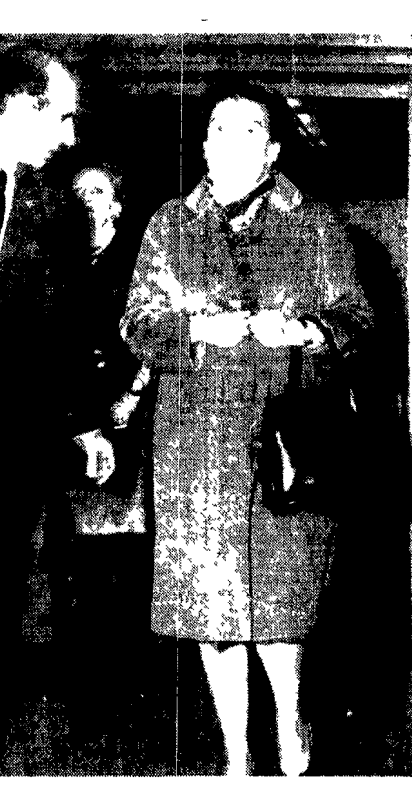
AMALIA FLEMING ESPULSA DALLA GRECIA

La frenetica attività del prof. Giordano, direttore dell'Istituto di anatomia e istologia patologica dell'università - Il laboratorio di analisi cliniche: dai 7 milioni del 1967 agli 80 del 1970 - 41 milioni in quattro anni al professore - La serie delle consulenze (anche di se stesso) - Un «aiuto» regolarmente pagato per 12 anni (senza presentarsi al lavoro) - Le conseguenze su insegnamento e ricerca