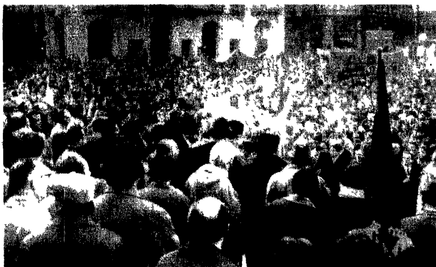
Imponenti manifestazioni antifasciste ieri in numerose città. Nella foto a sinistra un aspetto di Piazza Castello a Torino affollata da migliaia di cittadini; a destra il raduno popolare nel rione delle Panche a Firenze durante la rievocazione dell'eroica giornata del primo marzo 1921.

Un ampio schieramento di forze politiche - Significativa presenza di associazioni, rappresentanti degli Enti locali e dei Consigli operai - A Torino trentamila in corteo - A Firenze rievocate le barricate delle Panche - Iniziative a Bologna in scuole, fabbriche e quartieri - A Catanzaro e Cosenza isolate le «adunate» missine: Almirante costretto a parlare circondato da nugoli di celerini