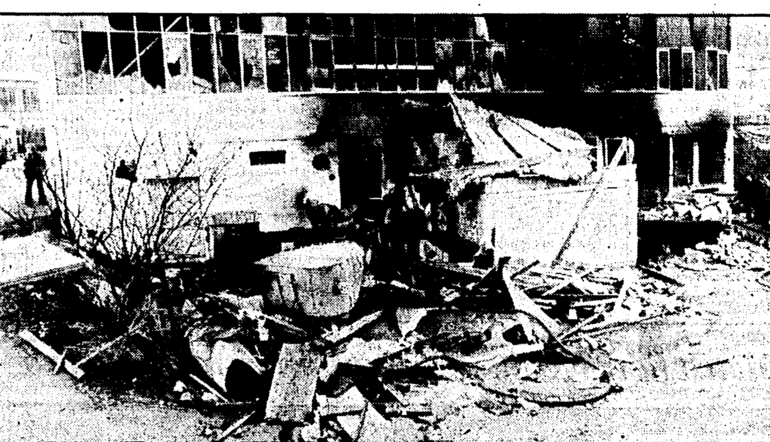
VELBER (RFT) — L'ingresso della piccola fabbrica semidistrutta dall'esplosione che ha ucciso gli emigrati siciliani

Quasi tutti provenienti da Castelbuono e imparentati tra loro - La settimana vittima è un tedesco - Un operaio è gravissimo - In viaggio con i familiari