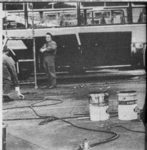
Novara: Gli stabilimenti di montaggio per autobus della Fiat.