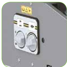
Tableau électrique avec interrupteur de marche et thermostat de régulation de la température d'eau en sortie.