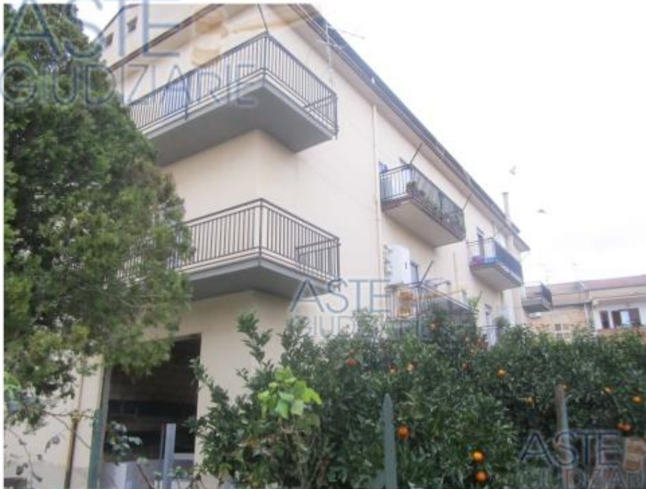
Foto 4 Stabile di cui al foglio 7, particella 866, ingresso U.I. 866 sub 2 al piano terra (immobili 4) e balconi U.I. particelle 866 sub 5 e 6 (immobili 1 e 2) al secondo piano.