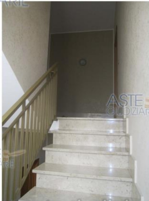
Foto 5 Stabile di cui al foglio 7, particella 866, scala di accesso alle U.I. particelle 866 sub 5 e 6 (immobili 1 e 2) al secondo piano.