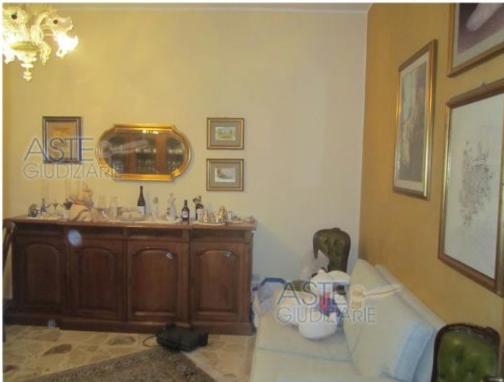
Foto 12 Immobile 2 Particella 866 sub 6 -vano soggiorno-