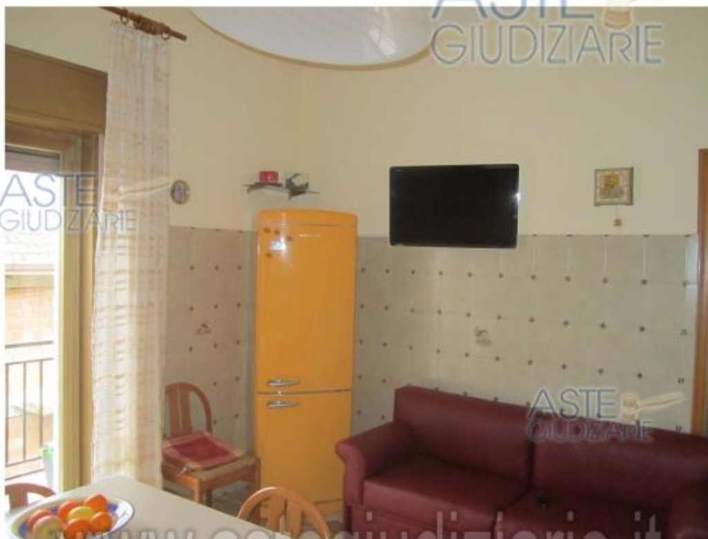
Foto 13 Immobile 2 Particella 866 sub 6 -cucina-