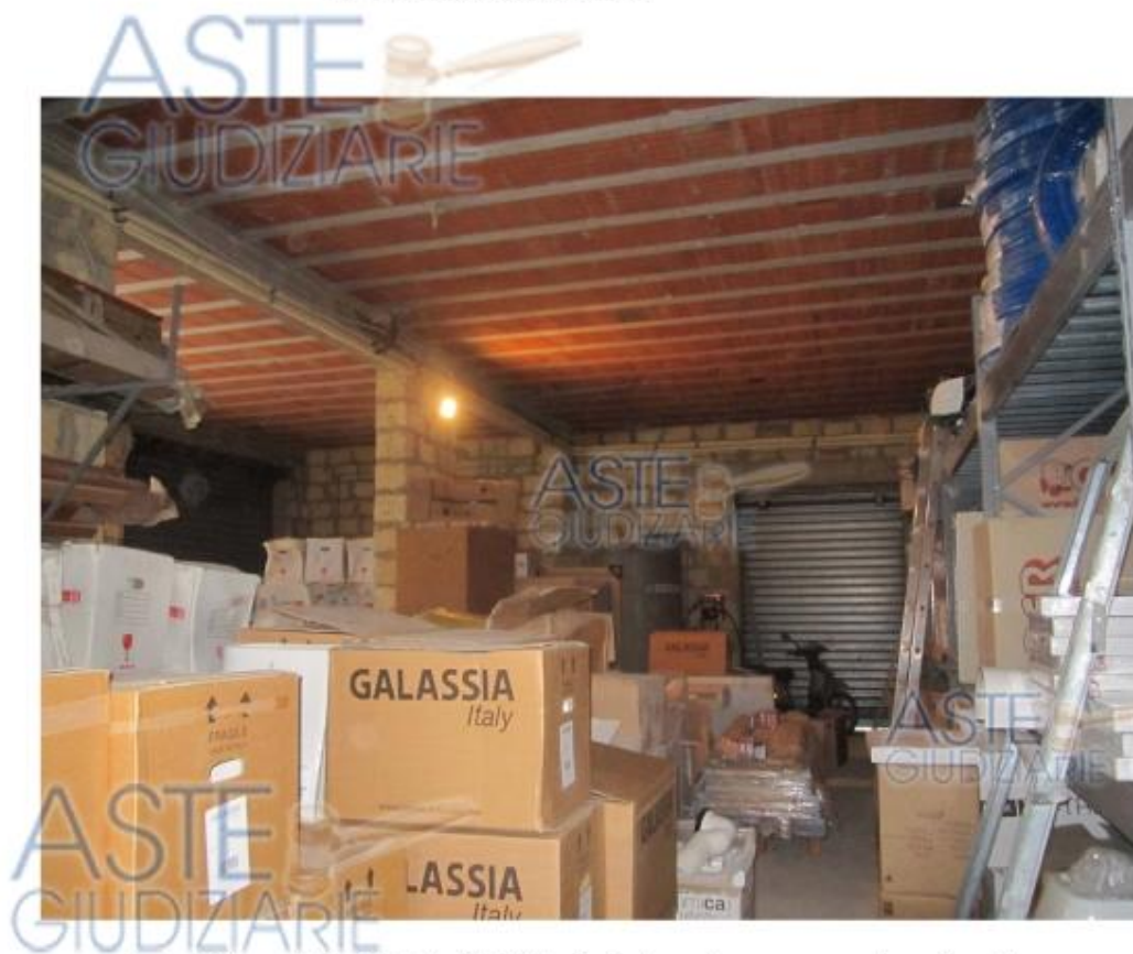
Foto 20 Immobile 4 Particella 866 sub 2 piano terra –magazzino al rustico-