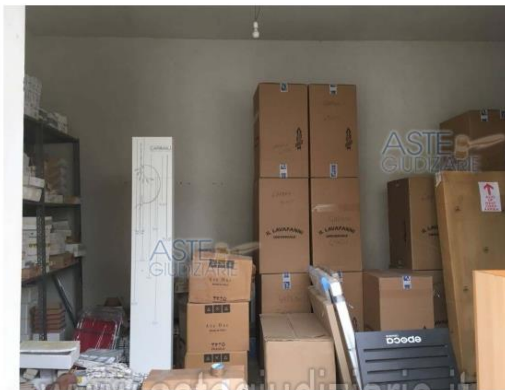
Foto 19 Immobile 3 Particella 866 sub 1 piano terra –magazzino rifinito-