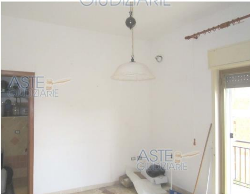
Foto 8 Immobile 1 Particella 866 sub 5 – cucina e ingresso doppio servizio-