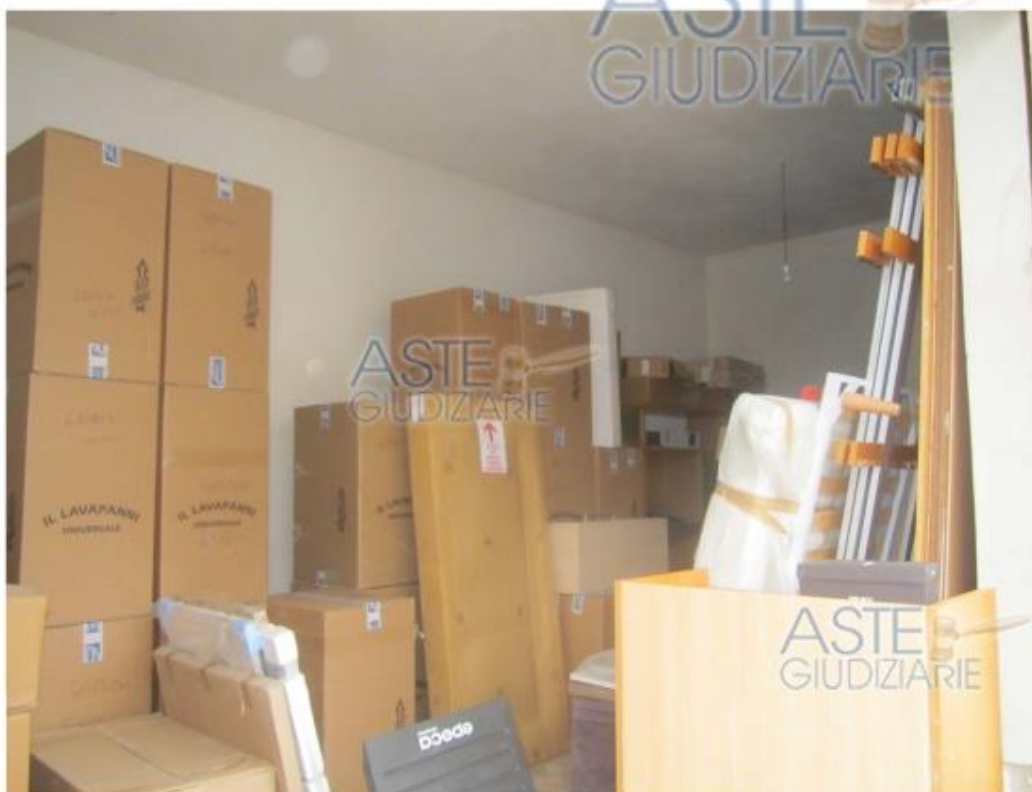
Foto 18 Immobile 3 Particella 866 sub 1 piano terra –magazzino rifinito-