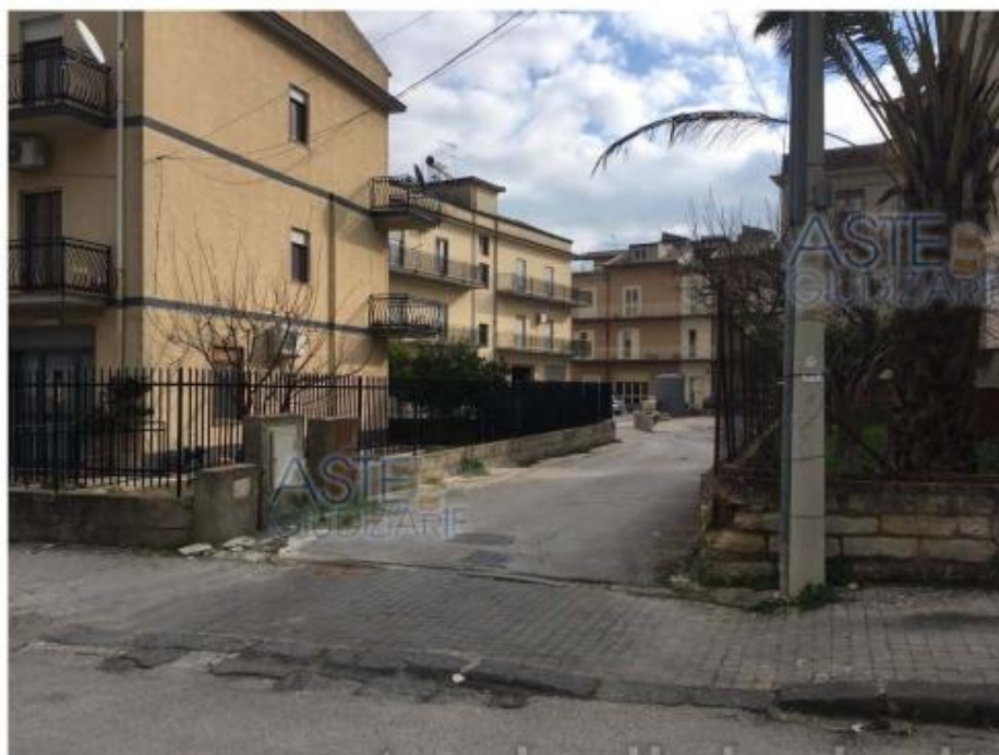
Foto 1 Accesso allo stabile da Via Rimembranza, da servitù di cui al foglio 7, particella 848