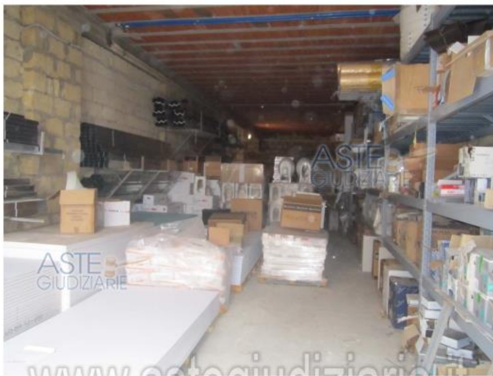
Foto 21 Immobile 4 Particella 866 sub 2 piano terra –magazzino al rustico-