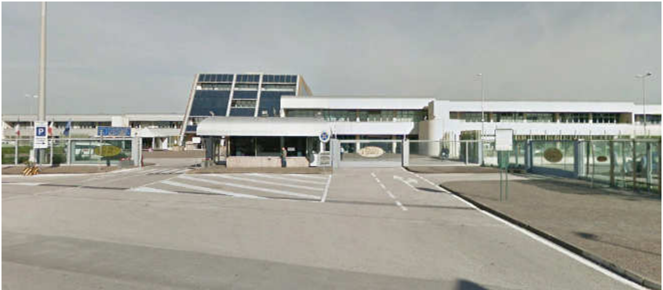
Vista zona ingresso Centro Orafi Il Tari