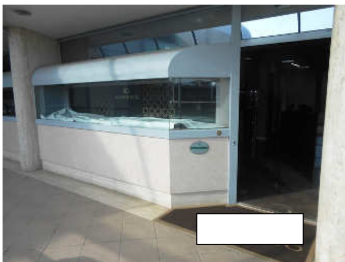
Ingresso con vetrina espositiva

Il modulo commerciale è ubicato nel blocco A/6 al piano primo raggiungibile percorrendo un ballatoio coperto prospiciente la piazza interna. Il modulo ha una forma rettangolare allungata, con una superficie di circa 150,00 mq netti, il cui ingresso è posizionato sul detto ballatoio dove è prospiciente la vetrina espositiva. Entrando è presente un accogliente salottino con teche espositive e banco cassa, proseguendo vi è un piccolo angolo dispensa ben nascosto e due sale con tavoli per la visione di gioielli e preziosi. Tra le due sale è presente un blocco costituito da due servizi igienici.