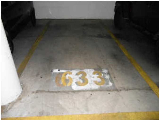
Posto auto n. 633 piano seminterrato