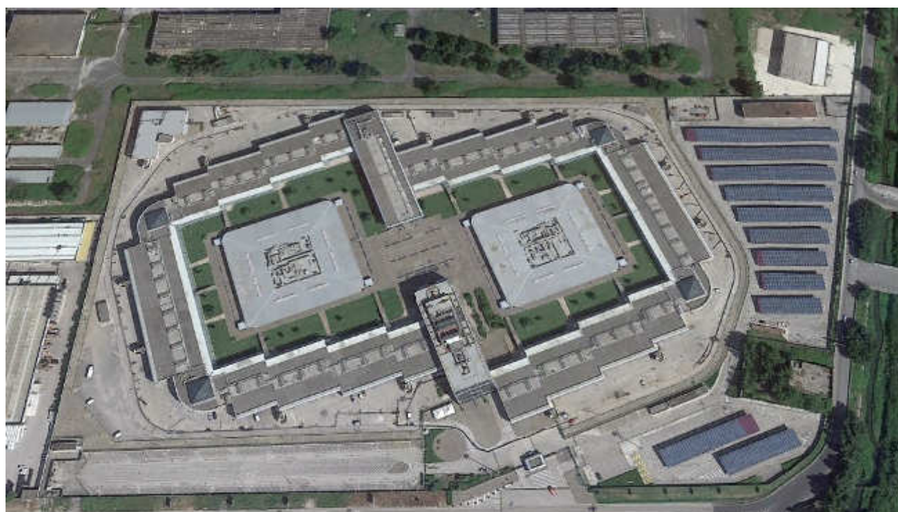
Vista dall'alto Centro Orafi il Tari