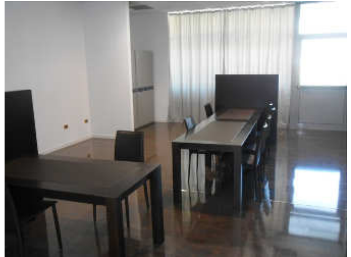
Le sale interne per la visione dei preziosi