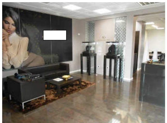
Salottino di accoglienza