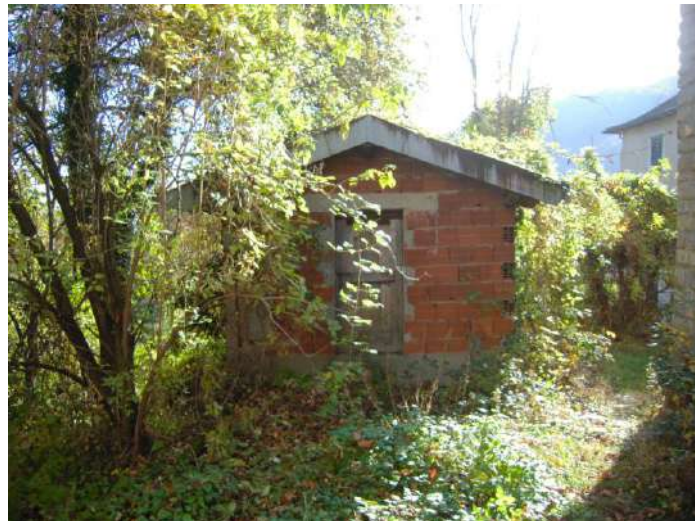
Foto 1 – Vista lato Est con fabbricato rurale annesso alla part.lla 1629

Immobile: Fog. 9 part.lla n. 1009 e Fog. 2 part.lla n. 1629