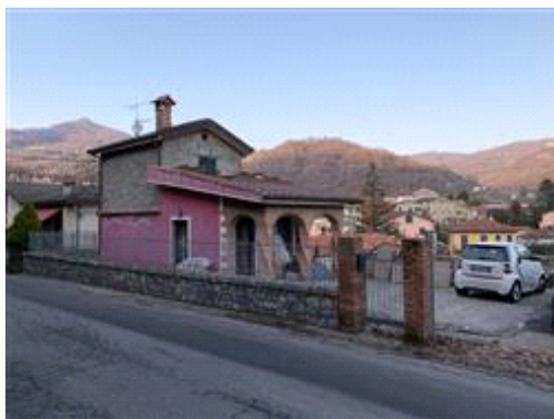
Prospetto su Via Aldo Moro

Con variazione del 09/11/2005 sono stati inseriti in visura i dati di superficie: Superficie catastale totale mq. 127 - Totale escluse aree scoperte mq. 107