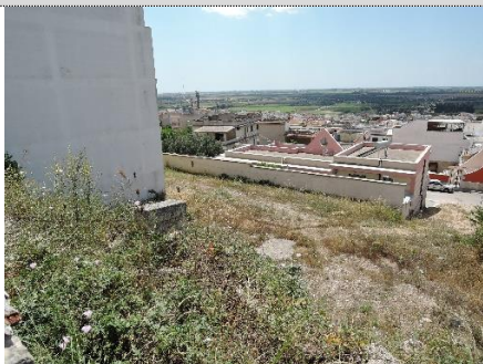
3. Accesso da via Grazia Deledda - vista sulla corte esterna