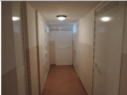
15. Sub.8 S.1. – corridoio di accesso al magazzino