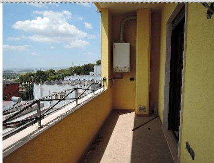
14. Sub.15 P.T. – Balcone