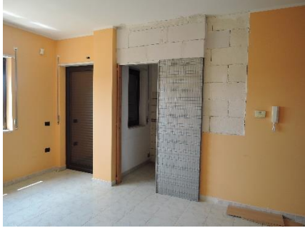
9. Sala di attesa sub.15 P.T. – particolare del tramezzo di collegamento con la segreteria