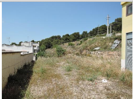
7. Piazzale map.528 – assenza di confine