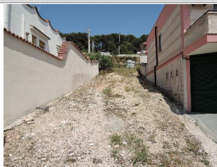
4. Accesso da via Jan Palach–strada sterrata servitù di passaggio