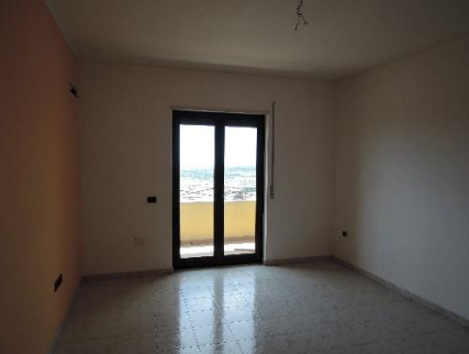
11. Sub.15 P.T. - camera