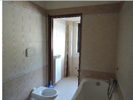
12. Sub.15 P.T. – bagno con tramezzo non assentito