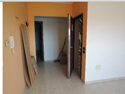
8. Sala di attesa sub.15 P.T. – collegamento con il disimpegno