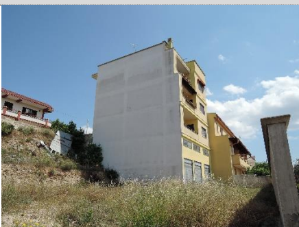
5. Piazzale map.528