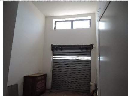
16. Sub.5 S.2. – box auto