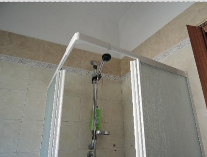
13. Sub.15 P.T. – realizzazione di vano doccia nel bagno