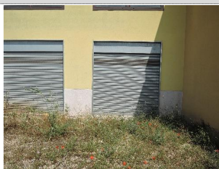
6. Box auto sub.5 - accesso