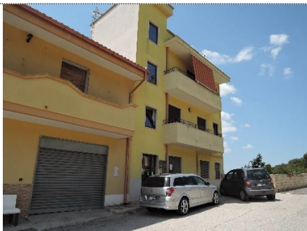
1. Accesso da via Grazia Deledda – vista esterna fronte strada