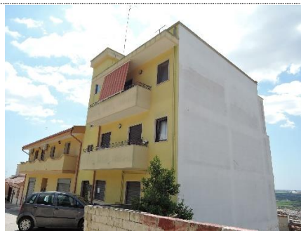
2. Accesso da via Grazia Deledda - vista esterna