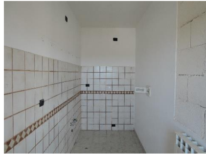
10. Segreteria sub.15 P.T. – differente destinazione d'uso