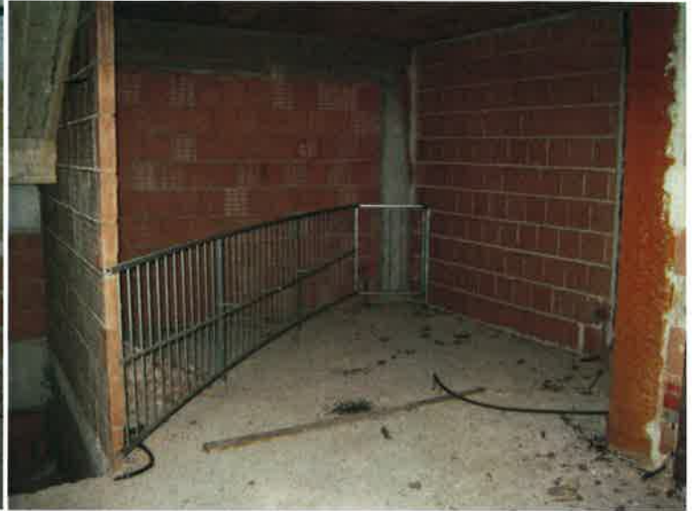
Vista del soggiorno