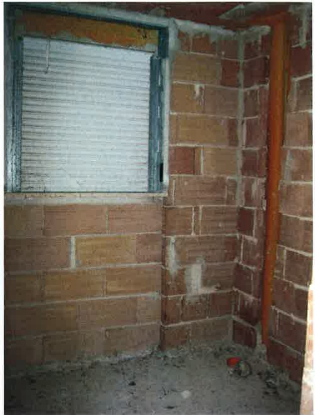
Vista del bagno