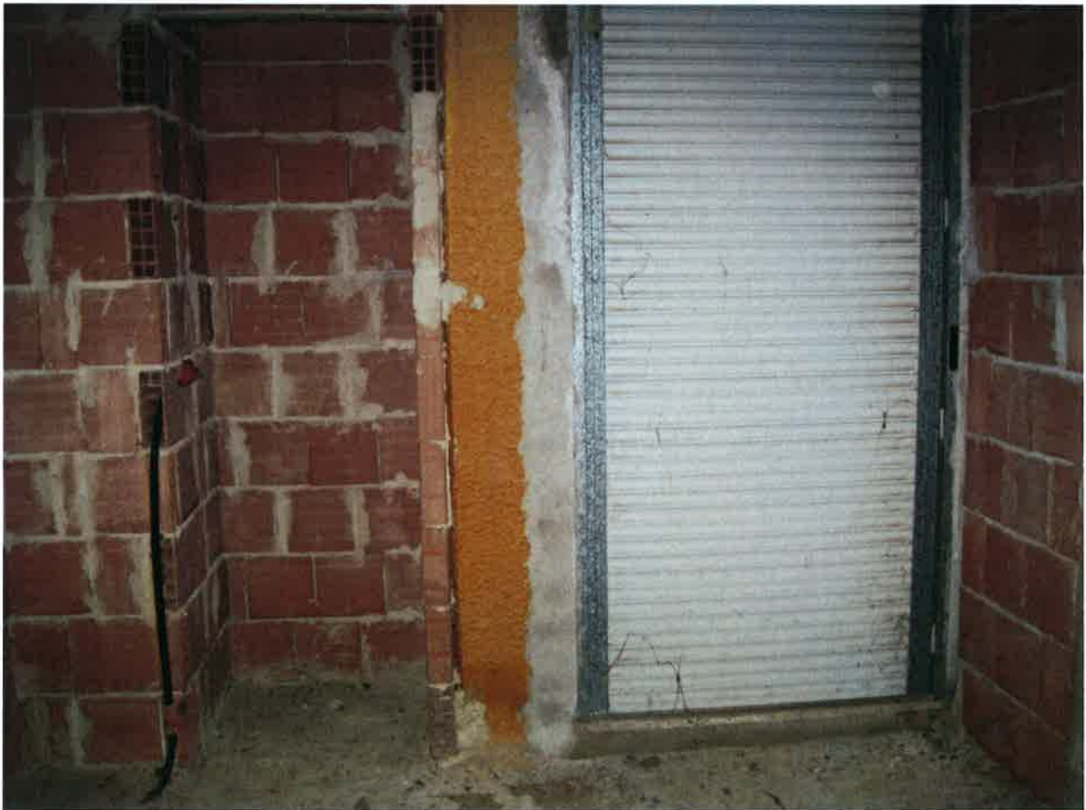
Vista della cucina