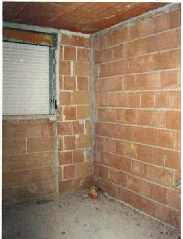
Vista del bagno