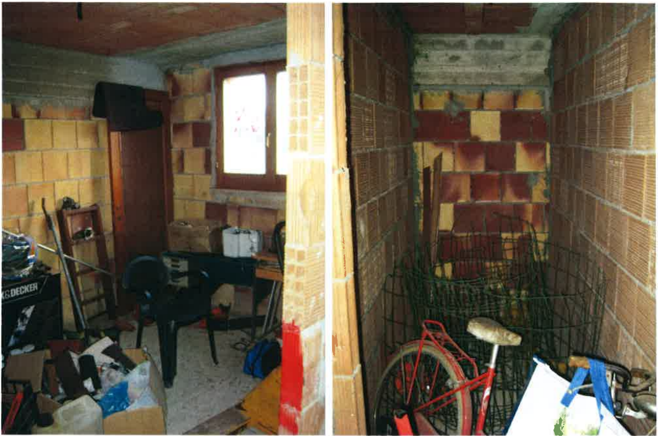
Vista dell'interno della cantina e del ripostiglio