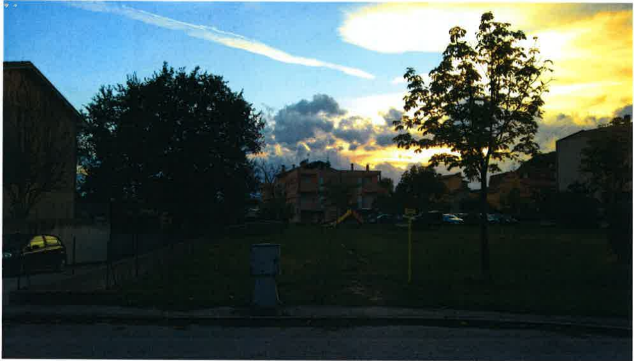
Vista dell'edificio da via Berta con antistante giardino pubblico