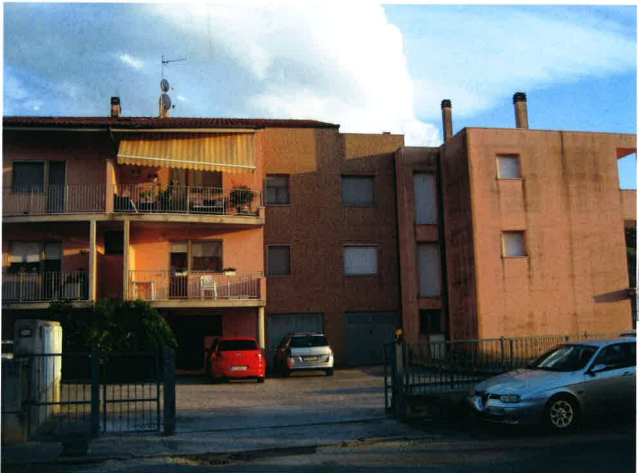
Vista del prospetto Ovest dell'edificio, sul quale è situato il cancello di ingresso.