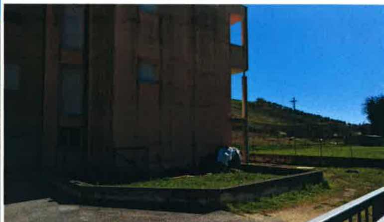
Vista del prospetto Ovest sul quale sono collocate le unità immobiliari oggetto di stima.