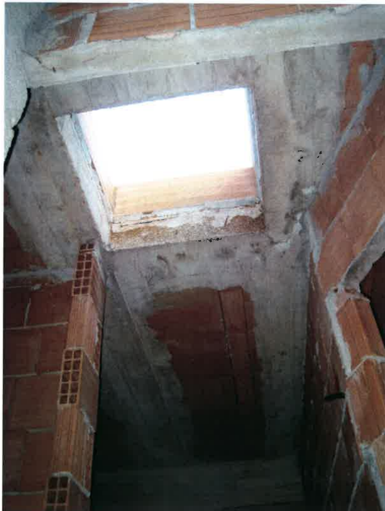
Vista della botola di accesso a tetto