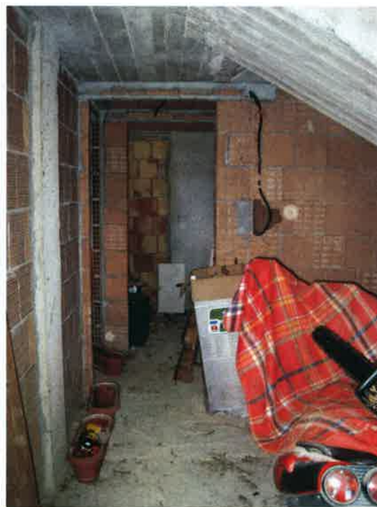
Vista dell' ingresso dall'esterno e dall'interno.