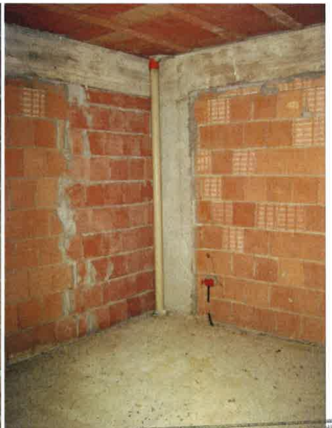
Vista della camera singola