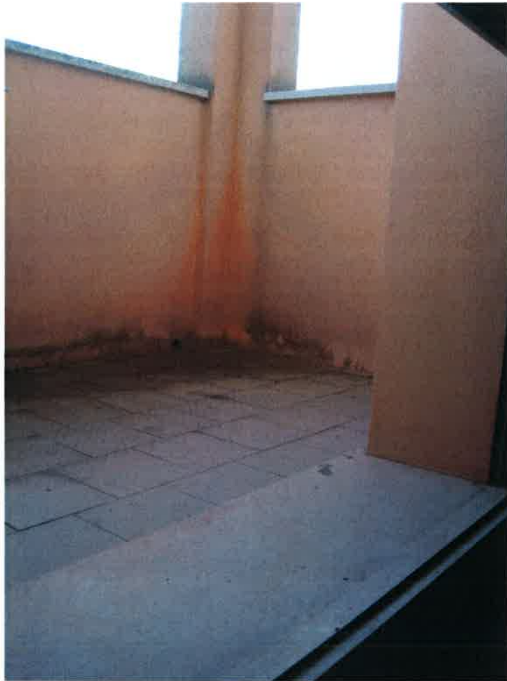
Vista del balcone