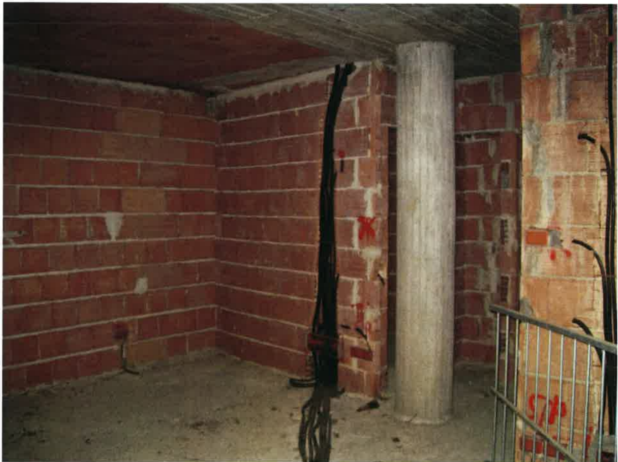
Vista del soggiorno