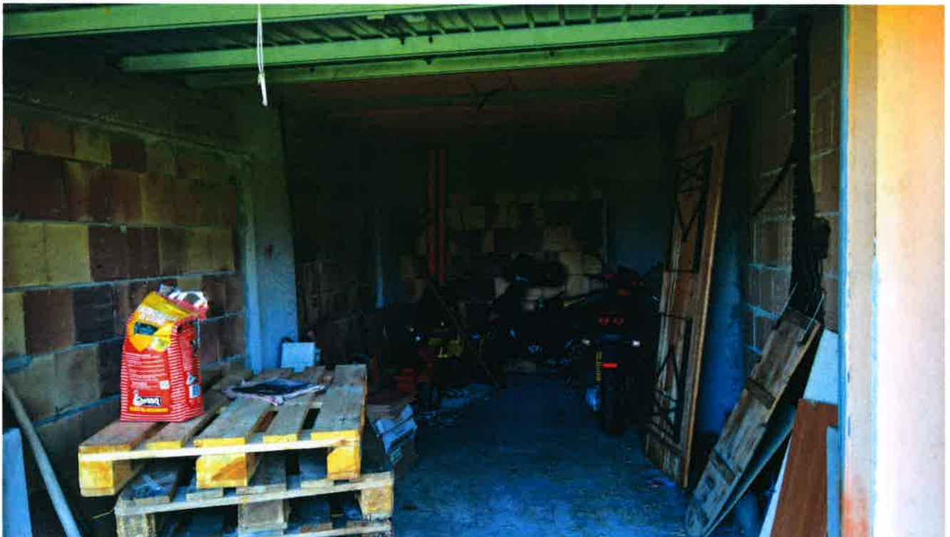
Vista del garage