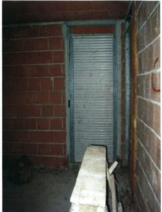
Vista della camera matrimoniale