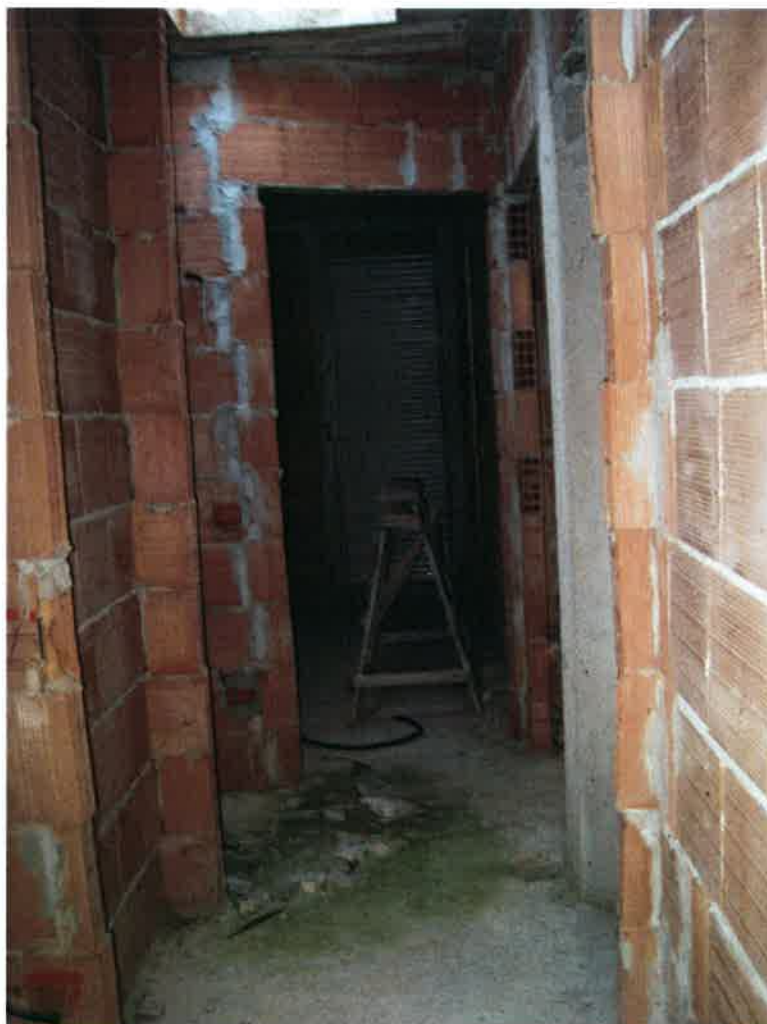
Vista del disimpegno