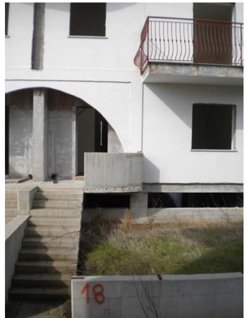
Foto 8 ingresso unità18