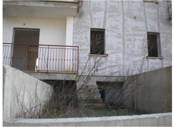
Foto 10 cortile/giardino - unità18 -lato nord