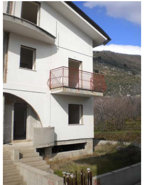
Foto 2 fronte sud su stradina pedonale