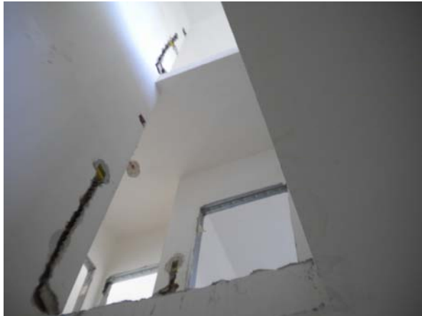
Foto 25 interno botola scala - unità 19