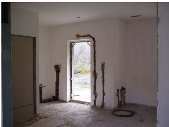
Foto 23 interno p. rialzato sogg. - unità 19