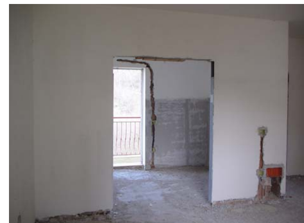
Foto 24 interno p. rialzato cucina-unità19