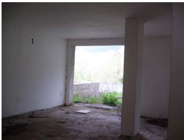
Foto 21 interno seminterrato - unità 19