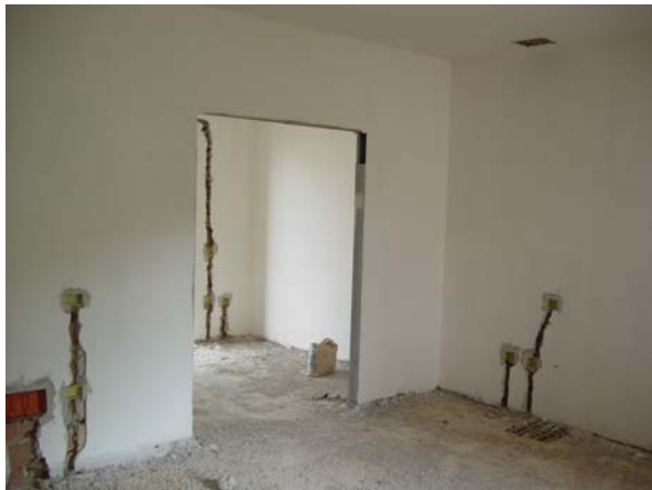
Foto 17 interno cucina - unità 18