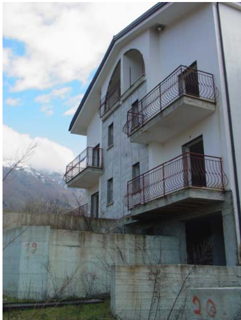
Foto 3 fronte nord su strada interna parco