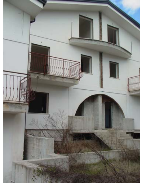
Foto 6 fronte sud ingressi