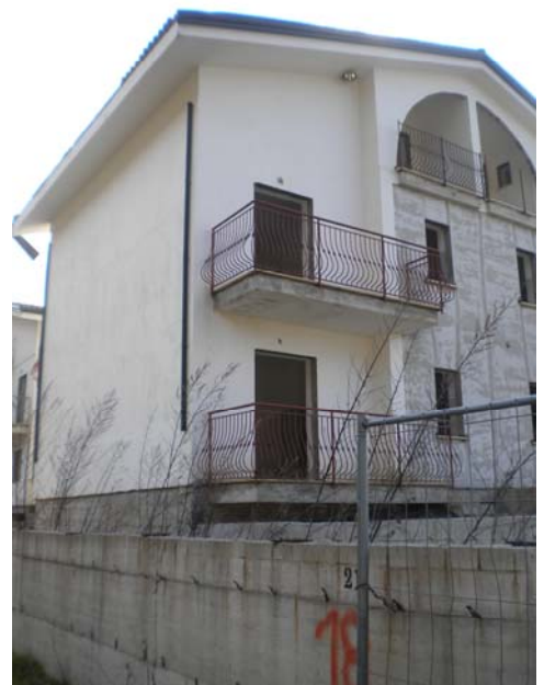
Foto 4 fronte nord/est