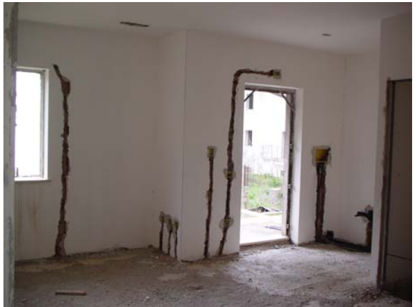
Foto 16 interno soggiorno/ingresso- unità18