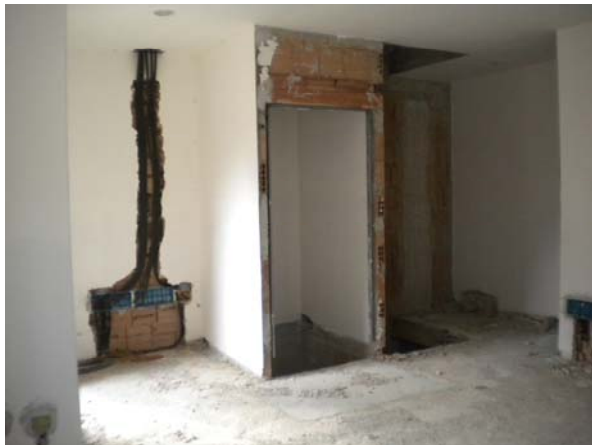
Foto 15 interno soggiorno - unità 18