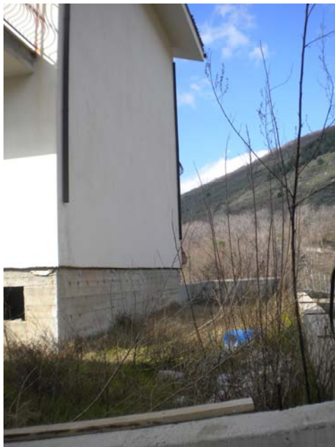
Foto 7 fronte est cortile su strada Rio Secco