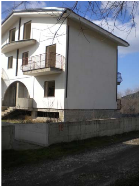
Foto 1 fronte sud/est su via Rio Secco