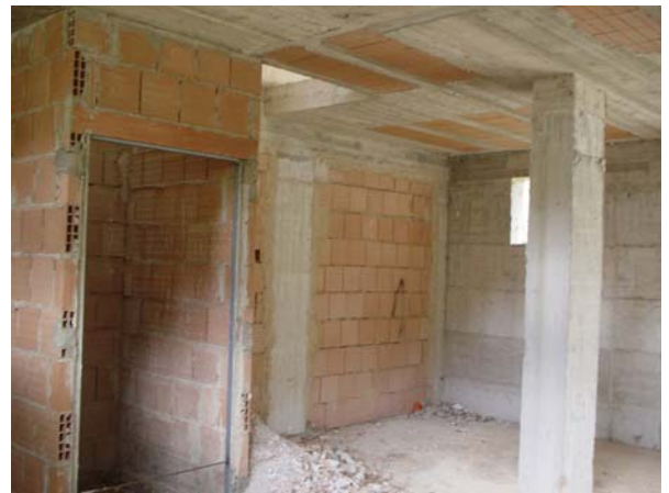
Foto 12 interno seminterrato - unità18