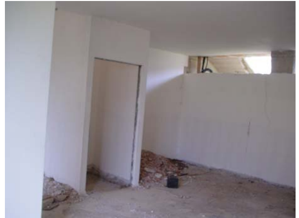
Foto 20 interno seminterrato- unità19