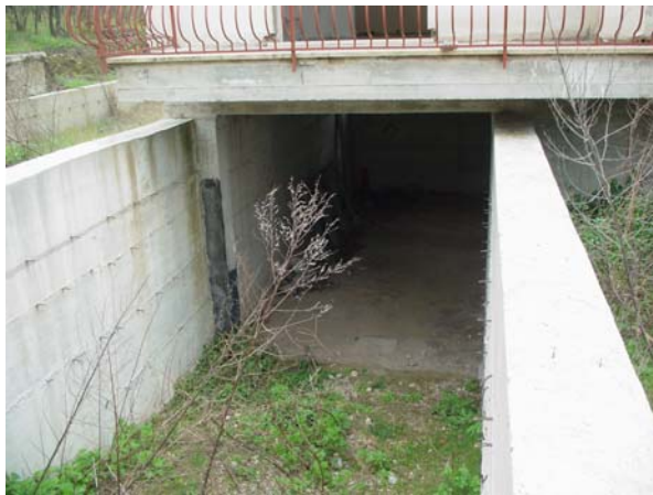
Foto 11 rampa garage unità18 - lato sud