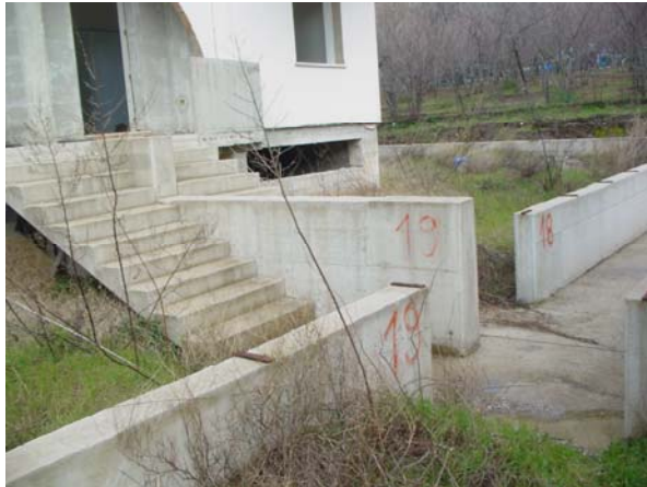
Foto 19 ingresso - unità 19