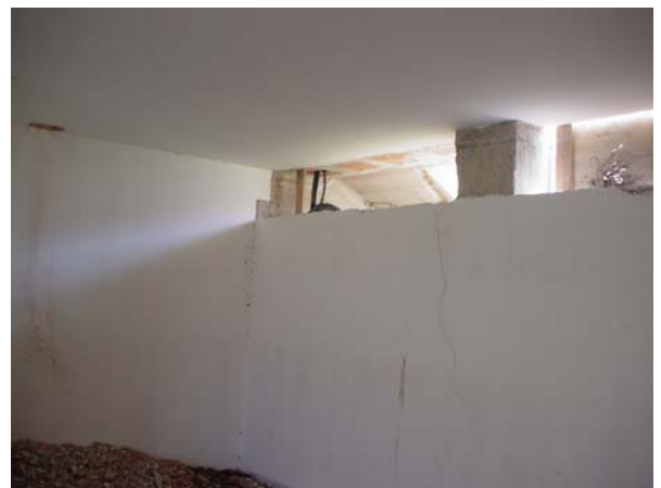
Foto 22 interno seminterrato- unità19