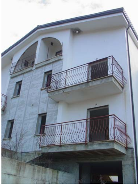
Foto 5 fronte nord su strada interna parco