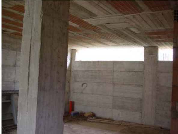
Foto 13 interno seminterrato unità 18