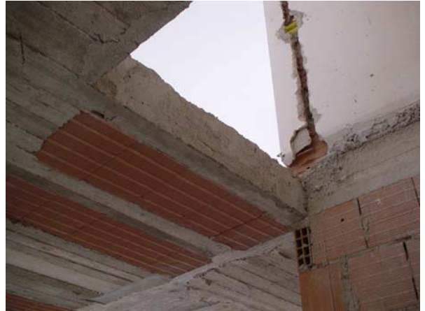
Foto 14 botola scala seminterrato - unità18