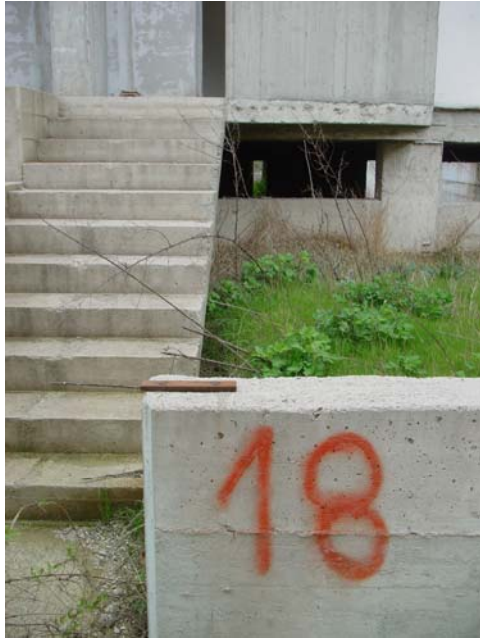
Foto 9 ingresso unità18 lato sud