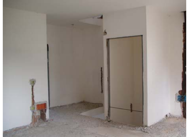
Foto 26 interno p. rialz. ascensore-unità19