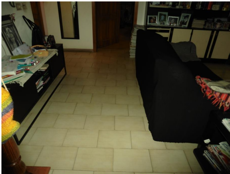
(Pavimentazione interna dei locali)