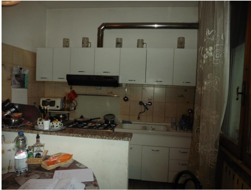
(Parete attrezzata della cucina)