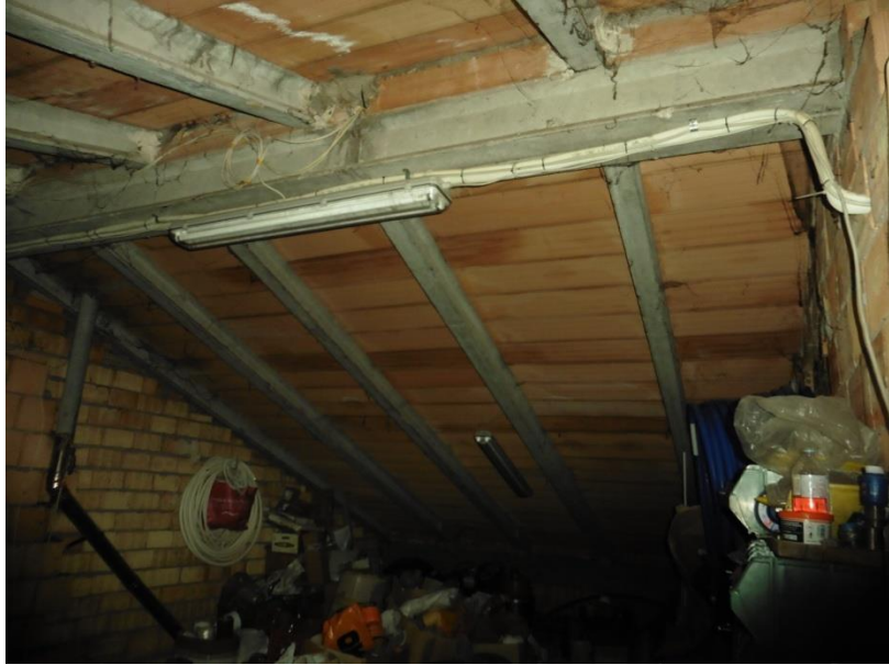
(Soffitta allo stato grezzo )