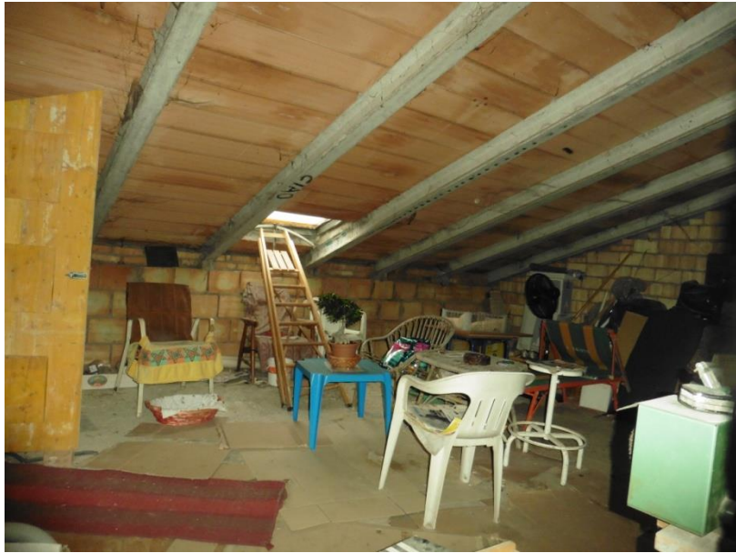
(Soffitta allo stato grezzo )