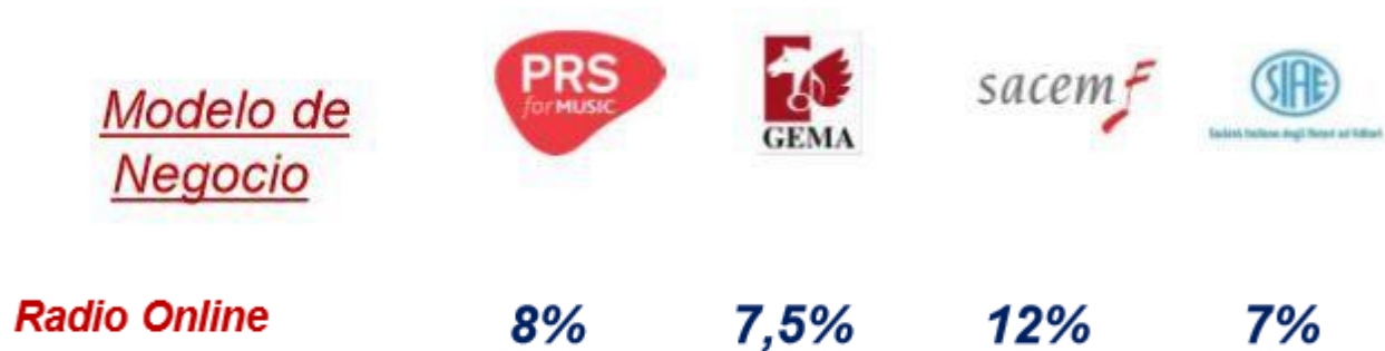
Figura 2. Tarifes locals. Entitats de la Unió Europea