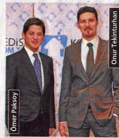
İhtiyaç kredilerine özel internet sitesi kurulacak

İtalya'da online konut kredisi danışmanlığı alanında pazar lideri olan ve yılda 2 milyar euroyu aşkın online kredi kullandıran Gruppo MutuiOnline ile ortak olan kredi danışmanlık şirketi Konut Kredisi Com Tr A.Ş.'nin aynı isimle kurduğu internet sitesi, son dönemde 'ucuz maliyetli konut kredisi' arayışında olan tüketicilerden yoğun bir talep alıyor. Başvuran tüketicilerin gelir durumu ve konut tercihlerine göre 14 bankanın kredi alternatifleri arasında en uygununu bulan site, faizlerin yükselmesine ve temkinli büyüme beklentilerine rağmen ayda 200 bin konut kredisi sorgusu alırken, özel-