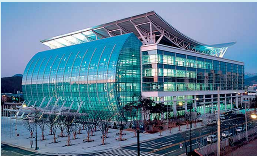
EXCO-Konferenzzentrum, mit 502 kWp-Dachanlage und geothermischem Heiz- und Kühlsystem ein Symbol für die umweltschonende Zukunft von Veranstaltungszentren

Wie man in Deutschland neue Verfahren zur Nutzung des CO 2 vorantreibt, erläuterte in