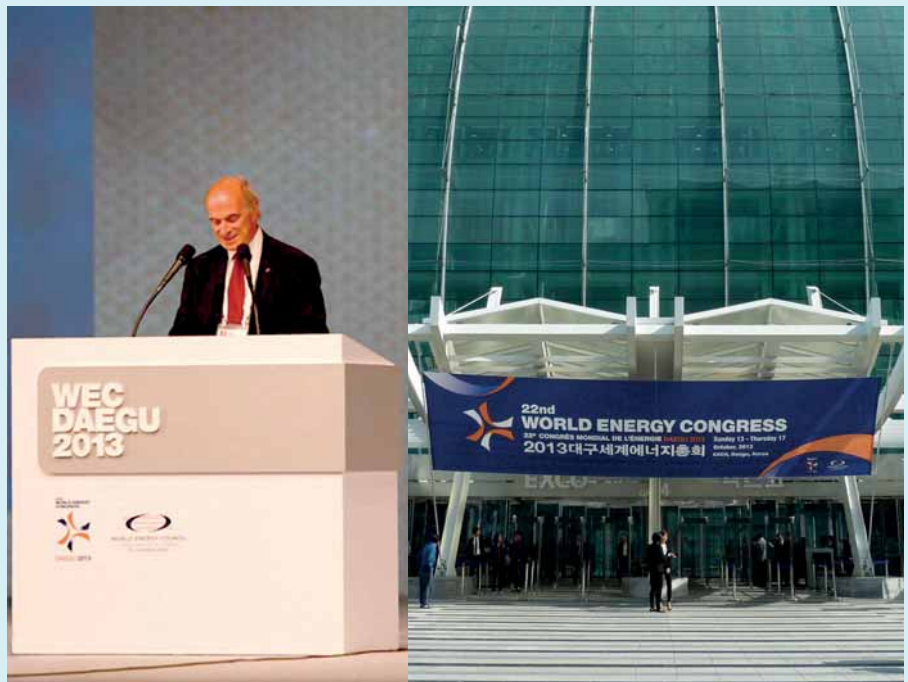
Die Weltenergiekonferenz fand mit Daegu in ihrer 90jährigen Geschichte (nach Tokyo 1995) zum zweiten Mal in Asien statt. Mögliche Energieträgerzukünfte wurden im EXCO diskutiert – Bodenhaftung war garantiert, im Bild WEC-Präsident Pierre Gaddoneix bei der Kongresseröffnung

Die Weltenergieversorgung sieht sich heute einer dreifachen Herausforderung gegenüber. Zum einen wird der Primärenergiebedarf, weiter unten darzustellenden Szenarien zufolge, bis 2050 auf jeden Fall deutlich steigen. Zum anderen gilt es, jenen 1,3 Mrd.