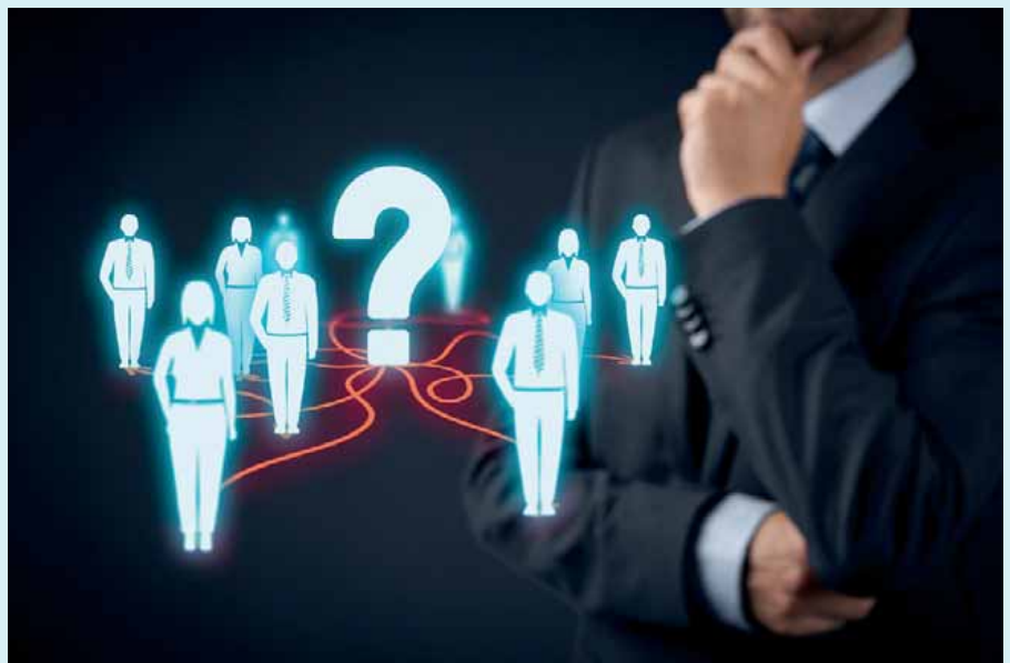
Angesichts des Vertrauensverlustes in Politik und Vorhabenträger wird die Mobilisierung der Bürgerinnen und Bürger für die Energiewende eine stetige Herausforderung bleiben

Die Bekanntheit, das Wissen und die Einstellungen der deutschen Bevölkerung zur Förderung von Schiefergas wurden erstmals in der repräsentativen Befragung des Forschungszentrums Jülich von 2011/12 erhoben [3]. Um zu untersuchen, wie sich die Bekanntheit, das Wissen und die Einstellun-