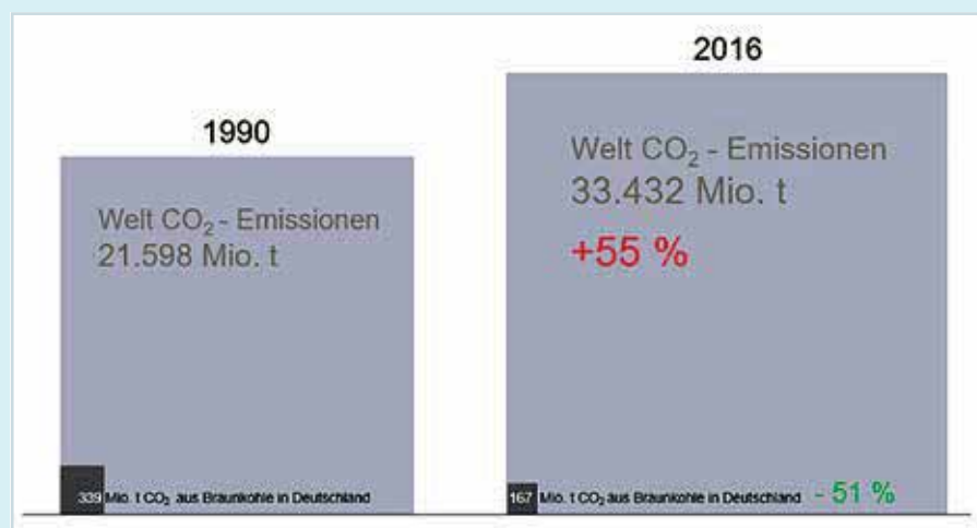
Abb. Braunkohlenausstieg in Deutschland: Ein Beitrag zur Rettung des Weltklimas?