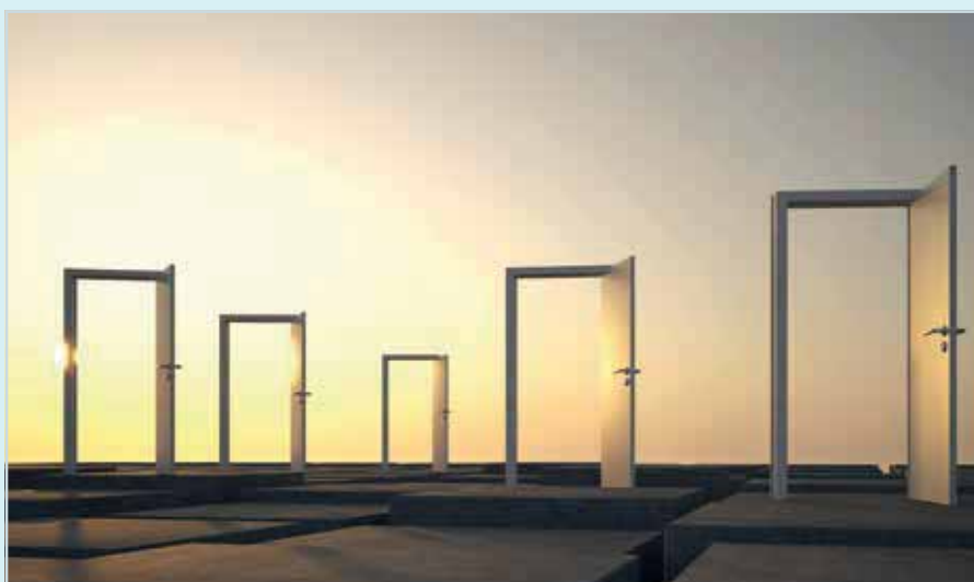
Den Kern der BDI-Studie bilden fünf Klimapfade

Das Referenzszenario schreibt die heutigen klimapolitischen Rahmenbedingungen fest (Current Policies Scenario) und beschreibt, welche Treibhausgasreduktionen sich bereits damit bis 2050 ergeben werden. Eine zentrale Annahme, die schon im Referenzszenario verankert ist, stellt ein umfangreicher und effektiver Carbon-Leakage-Schutz dar [1]. Weitere Annahmen sind die Fest- und Fortschreibung der heute geltenden Gesetze und Verordnungen [2]. Zudem wird unterstellt, dass es eine perfekte Regulierung gibt, die Politik also die richtigen Entscheidungen zur richtigen Zeit trifft [3]. Die BDI-Studie simuliert das deutsche Stromnetz 2050 als Kupferplatte. Zur Netzstabilität tragen