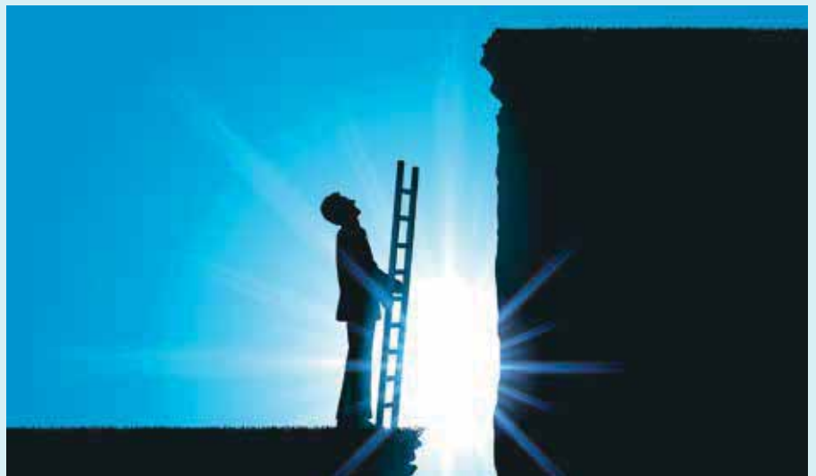
Aktuelle Daten deuten darauf hin, dass die Energieverbrauchsvorgabe 2020 verfehlt wird

Bei der Energieeffizienz werden zwei Größen zueinander in Beziehung gesetzt. Die eine Größe erfasst den Energieinput. Die andere erfasst den Output, der mit dem Input in Verbindung steht. So wird etwa die Energieeffizienz eines Fahrzeugs durch den Treibstoffverbrauch pro gefahrenen Kilometer beschrieben. Es ist offensichtlich, dass ein Fahrzeug umso effizienter ist, je geringer der Treibstoffverbrauch pro gefahrenen Kilometer ist. Was besagt dagegen der Begriff Energieeinsparung? Von Energieeinsparung zu sprechen ist nur gerechtfertigt, wenn der Verbrauch von Energie absolut zurückgeht. Bleibt