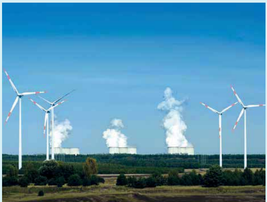
Konventionelle Kraftwerke leisten heute und in Zukunft einen wichtigen Beitrag zur Systemsicherheit im Stromnetz

Um die installierte Leistung der Erneuerbaren von aktuell 112 GW sachgerecht einordnen zu können, ist zu berücksichtigen, dass derzeit konventionelle Kraftwerke mit insgesamt 93 GW Leistung am Netz sind. Beide Erzeugerarten treffen auf einen Strombedarf, der zwischen 40 GW (Schwachlast) und 80 GW (Höchstlast) schwankt. Infolge des Ausbaus der Stromerzeugung aus erneuerbaren Energiequellen werden