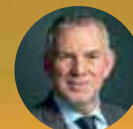
Jochen Flasbarth BMU