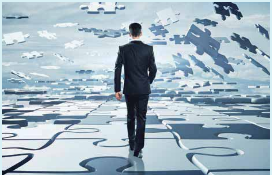
Die Hoffnung auf einen Generationenwechsel ist heute der vielleicht aussichtsreichste Weg, den begonnenen Umbau der Energieversorgung zum Erfolg zu führen

Sich mit Energiegeschichte zu befassen, ist ein schwieriges Unterfangen. Es hängt so vieles miteinander zusammen, dass man in einem überschaubaren Text immer nur einige Fäden aus einem Knäuel von Ereignissen, Entscheidungen und Entwicklungen herausziehen kann. Weiter wissen wir, dass unser Gedächtnis nicht immer zuverlässig arbeitet. Daher ist es ratsam, gelegentlich Originaleinschätzungen von Zeitzeugen zu hören. Wie war das also damals? Am 28.9.2010 legte die Bundesregierung ihr Energiekonzept vor [1]. Das Energiekonzept gilt gemeinhin als „Mutter der Energiewende“. Vermutlich haben nicht alle noch in Erinnerung (manche haben es vielleicht auch nie richtig