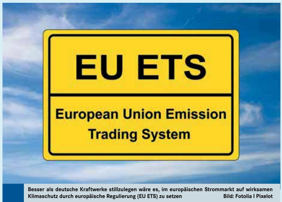
Besser als deutsche Kraftwerke stillzulegen wäre es, im europäischen Strommarkt auf wirksamen Klimaschutz durch europäische Regulierung (EU ETS) zu setzen

Kraftwerksstilllegungen oder andere Restriktionen für den Betrieb von Kohlekraftwerken in Deutschland führen im EU-Strombinnenmarkt infolge des länderübergreifenden Erzeugerwettbewerbs zur Verlagerung von Stromerzeugung und damit verbundenen Emissionen in unsere Nachbarländer. Das ist wenig überraschend. Denn wenn im Wettbewerb einseitig einem Akteur eine Beschränkung auferlegt wird, beispielsweise durch erzwungene Kraftwerksstilllegungen, dann passiert, was in jedem anderen Markt auch passiert: Die Wettbewerber freuen