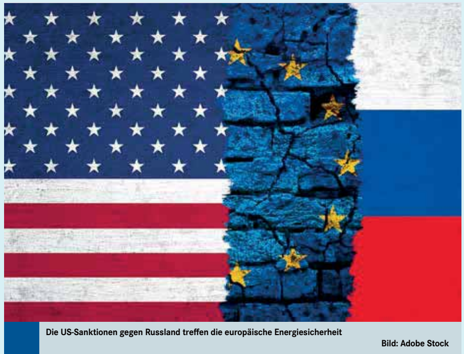
Die US-Sanktionen gegen Russland treffen die europäische Energiesicherheit

Darüber hinaus zielte der Erlass neuartiger, sog. sektoraler Sanktionen darauf, die Kosten für die langfristige Entwicklung der russischen Volkswirtschaft in die Höhe zu treiben. Zu diesem Zweck setzte das OFAC russische Unternehmen aus dem Finanz-, Rüstungs- und Energiesektor auf eine Sectoral Sanctions Identification (SSI)-Liste. Dadurch wird die Vergabe von Krediten durch natürliche und juristische US-Personen zeitlich wie folgt eingeschränkt: für gelistete russische Finanzinstitute darf die Laufzeit nicht mehr als 14 Tage betragen (Direktive 1), für russische Energieunternehmen nicht mehr als 60 Tage (Direktive 2) und für russische