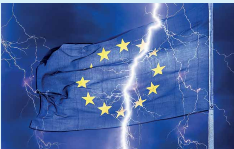
In der politischen Debatte hat das Ziel der „Klimaneutralität“ seit der Verabschiedung des Paris-Abkommens und insbesondere nach der Veröffentlichung des IPCC-Sonderberichtes zu einer Erwärmung von 1,5 Grad viel Aufmerksamkeit erfahren

Die EU hat sich 2015 in Paris verpflichtet, bis 2020 eine langfristige Emissionsminderungsstrategie vorzulegen. Zugleich besteht die Erwartung, dass die EU das im Paris-Abkommen angelegte Versprechen mit Leben erfüllt, die nationalen Beiträge zum globalen Klimaschutz (Nationally Determined Contributions, NDC) sukzessive zu erhöhen. Nur so kann die Hoffnung aufrechterhalten werden, dass sich die Welt von ihrem derzeitigen Kurs auf einen Temperaturanstieg von 3 bis 3,5 Grad Celsius (°C) bis zum Jahr 2100 in Richtung des in Paris vereinbarten Zielkorridors von 1,5 bis 2 °C bewegt. Folgt