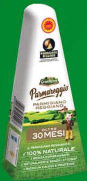
PARMIGIANO REGGIANO PARMAREGGIO GRANTERRE 30 MESI GR.250