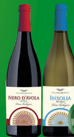
VINO COLOMBA BIANCA INSOLIA/ NERO D'AVOLA/ SYRAH CL.75