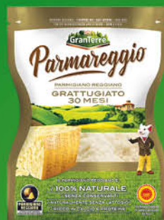
PARMIGIANO REGGIANO GRATTUGIATO PARMAREGGIO GRANTERRE 30 MESI GR.60