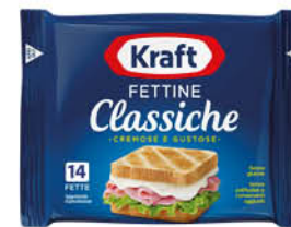
FETTINE KRAFT GR.350