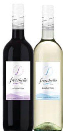
VINO FRESCELLO ROSSO/ BIANCO CL.75