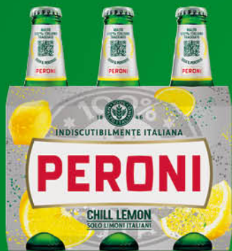
BIRRA CHILL LEMON PERONI CL.33X3