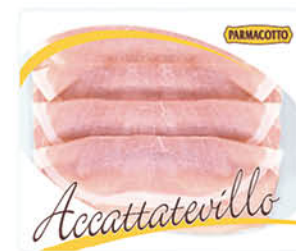
PROSCIUTTO COTTO SCELTO PARMACOTTO GR.100