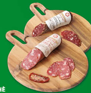
SALAME IMPICCIHÈ TRADIZIONALE/ AL PISTACCHIO/ CON POMODORO SECCO/ MAISSALA/ MONTALBANO PICCANTE/ AL NERO D'AVOLA GR.190