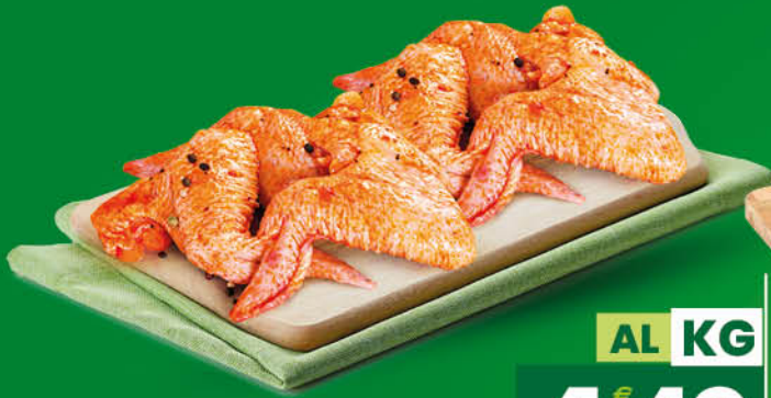
ALI DI POLLO ALLA DIAVOLA