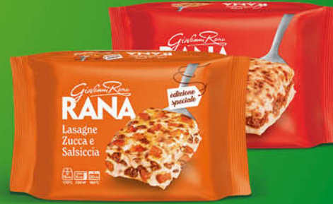
LASAGNE RANA ZUCCA E SALSICCIA/ PRIMAVERA/RAGÙ GR.350