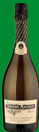
PROSECCO CARPENÉ MALVOLTI CL.75