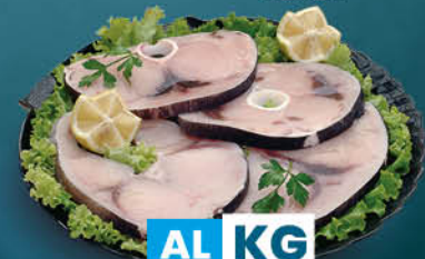
PESCE SPADA FRESCO