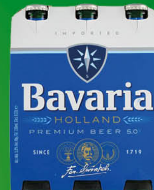
BIRRA BAVARIA ANALCOLICA/ PREMIUM CL.33X6