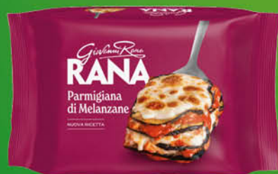
PARMIGIANA DI MELANZANE RANA GR.300