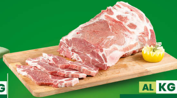
BRACIOLE DI SUINO