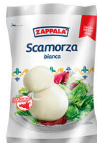
SCAMORZA ZAPPALÀ BIANCA/ AFFUMICATA GR.180