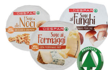
SUGO DESPAR ALLE NOCI/ AI 4 FORMAGGI/ AI FUNGHI GR.140