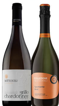
VINO COLLEZIONE SETTESOLI SAUVIGNON/ SPUMANTE BRUT/ ROSE/ BIANCO FRIZZANTE/ GRILLO E CHARDONNAY/ NERO D'AVOLA E SYRAH/ NERELLO E PINOT CL.75