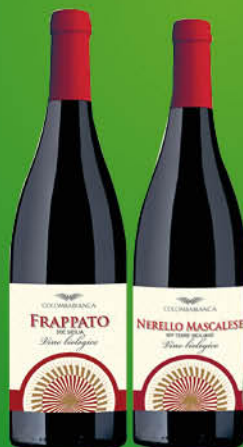
VINO COLOMBA BIANCA FRAPPATO/ NERELLO MASCALESE CL.75