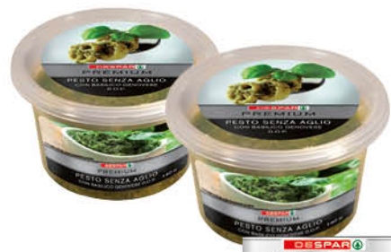
PESTO FRESCO DESPAR PREMIUM SENZ'AGLIO/ CON AGLIO GR.140