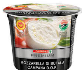
MOZZARELLA DI BUFALA DOP DESPAR PREMIUM GR.200