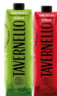
VINO TAVERNELLO ROSSO/ BIANCO/ ROSATO BRICK LT.1