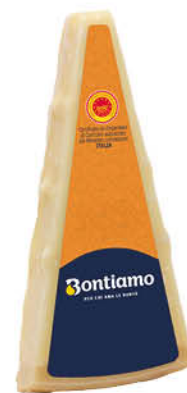
FORMAGGIO DURO ITALIANO BONTIAMO GR.200