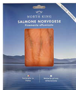
SALMONE TAGLIO SASHIMI CLASSICO/ CON PISTACCHIO/ AL SESAMO/ CON ALGA NORI GR.80