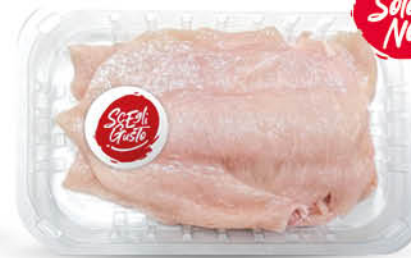
PETTO DI POLLO A FETTE SOTTILI SCEGLI GUSTO GR.250