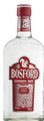
GIN BOSFORD CL.70