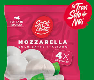
MOZZARELLA SVEGLI GUSTO GR.90X4