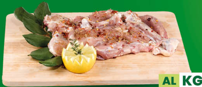
COSCETTE DI POLLO GRILL