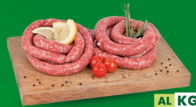
SALSICCIA CONFEZIONE FAMIGLIA