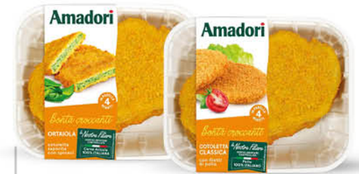
PANATI DI POLLO AMADORI ORTAIOLE CON SPINACI GR.550/ COTOLETTA CLASSICA GR.550