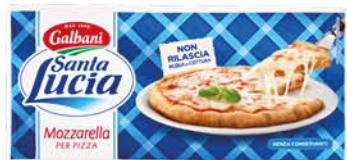
MOZZARELLA SANTA LUCIA PANETTO GR.400