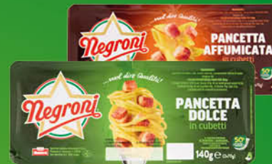
PANCETTA A CUBETTI NEGRONI DOLCE/AFFUMICATA GR.70X2