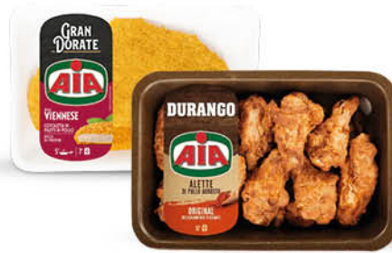
ALI PRECOTTE DI POLLO DURANGO GR.400/ COTOLETTA LA VIENNESE GR.300/ AIA