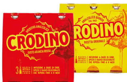
CRODINO ARANCIA ROSSA/ BIONDA CL.17,5X3