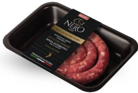
SALSICCIA DI SUINO NERO CON PEPE GR.250