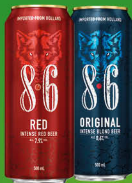
BIRRA BAVARIA 8.6% BIONDA/ IPA/ EXTREME/ RED LATTINA CL.50