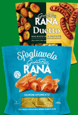
PASTA FRESCA RIPIENA RANA SFOGLIAVELO SPECK/ ALLA NORMA/ PROSCIUTTO CRUDO/ SALMONE/ DUETTO SALSICCIA E PATATE/ BURRATA E BASILICO GR.250