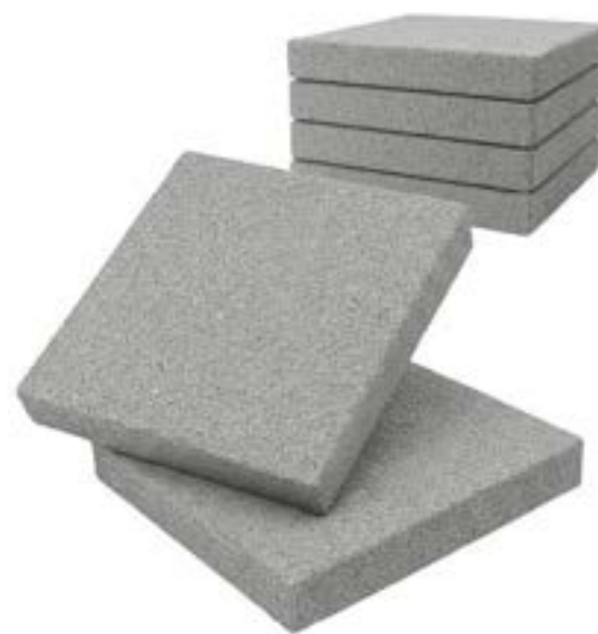
BASOLA STONE ANTRACITE CM.50X50