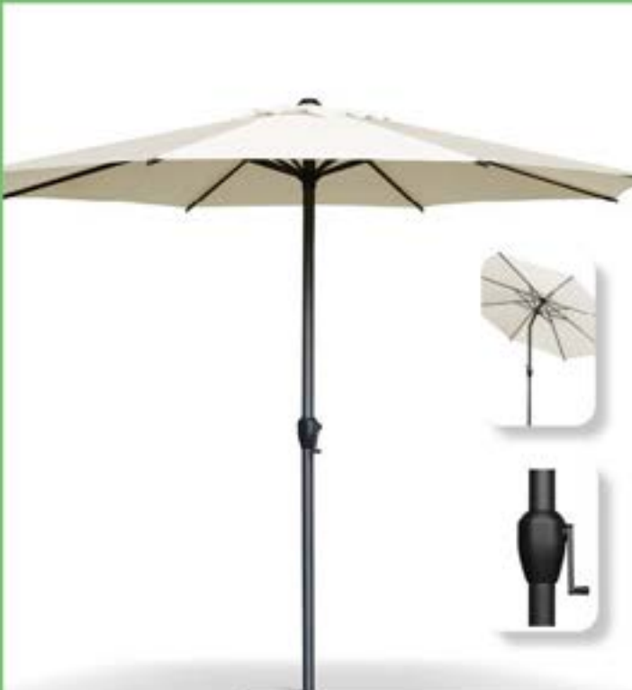
OMBRELLONE LYON CON PALO CENTRALE IN ALLUMINIO D.300