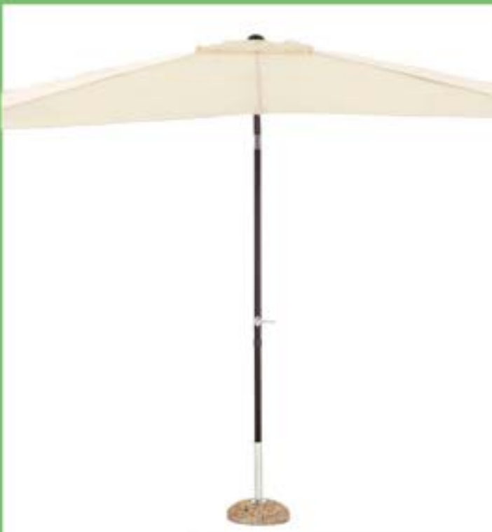
OMBRELLONE MT.2X3 P/CENT. ECRU

Offerte valide solo nei punti vendita dove è presente il reparto