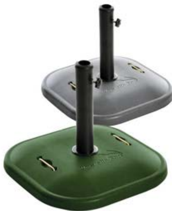
BASE OMBRELLONE KG.25 06902V