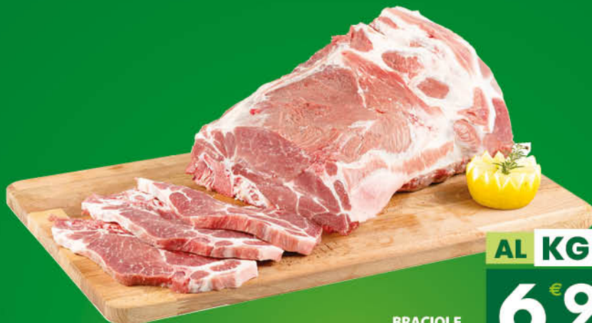
BRACIOLE DI SUINO