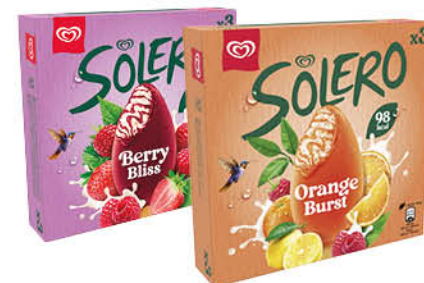
SOLERO ALGIDA ORANGE/BERRY BLISS X3