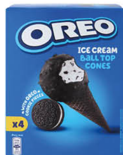
CONO OREO X4 GR.264