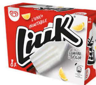
LIUK LIMONE ALGIDA X8 GR.632