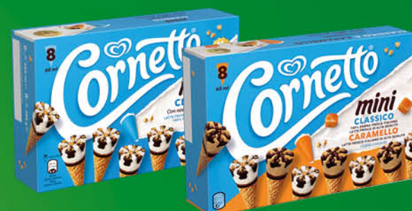
CORNETTO MINI ALGIDA PANNA E CAMELLO/ PANNA X8