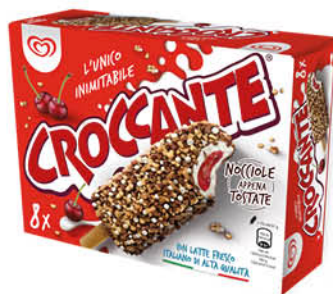
CROCCANTE ALGIDA ALL'AMARENA X8