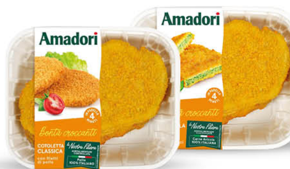
PANATI DI POLLO AMADORI ORTAIOLE CON SPINACI GR.550/ COTOLETTA CLASSICA GR.550