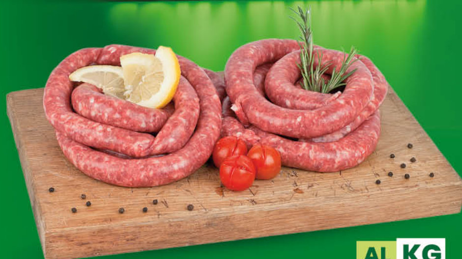
SALSICCIA CONFEZIONE FAMIGLIA