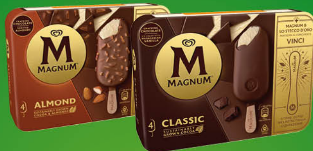
MAGNUM ALGIDA PISTACCHIO/BIANCO/ CLASSICO/MANDORLE X4