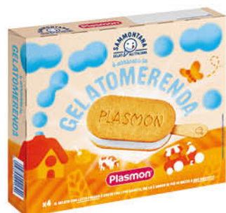
GELATO STECCO PLASMON SAMMONTANA X4