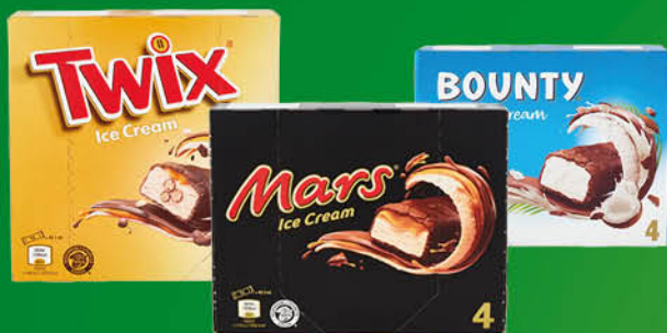
GELATO TWIX/ MARS/ BOUNTY/ SNICKERS X4