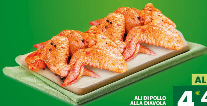
ALI DI POLLO ALLA DIAVOLA