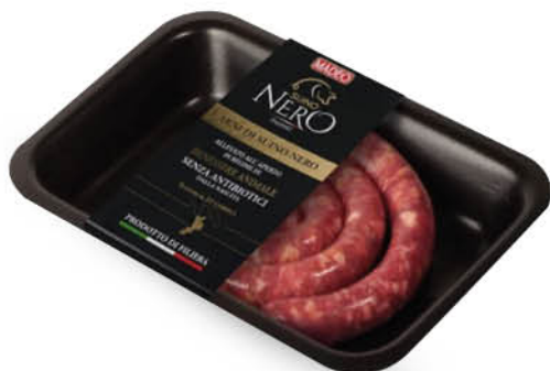
SALSICCIA DI SUINO NERO CON PEPE GR.250