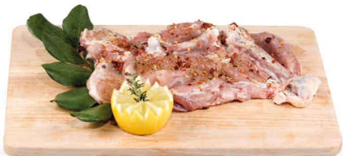
COSCETTE DI POLLO GRILL