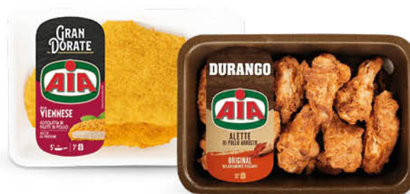
ALI PRECOTTE DI POLLO DURANGO GR.400/ COTOLETTA LA VIENNESE GR.300/ AIA