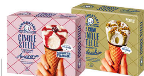
CONO 5 STELLE SAMMONTANA VARI GUSTI X6