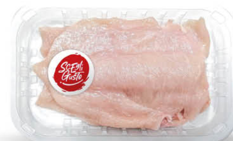
PETTO DI POLLO A FETTE SOTTILI SCEGLI GUSTO GR.250