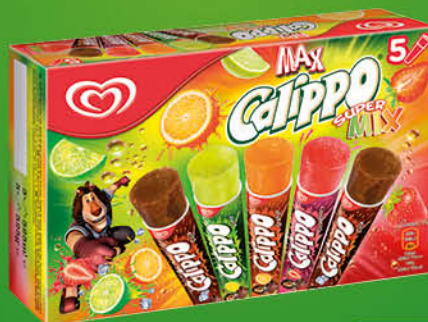
CALIPPO ALGIDA SUPER MIX/COLA X5