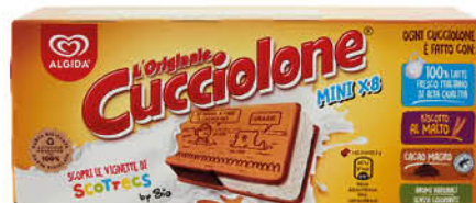
CUCCIOLONE MINI ALGIDA X8 GR.270