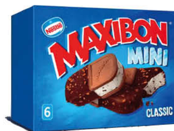
MAXIBON MINI NESTLÉ X6 GR.306