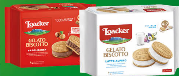
GELATO LOACKER NAPOLITANER/ LATTE X8