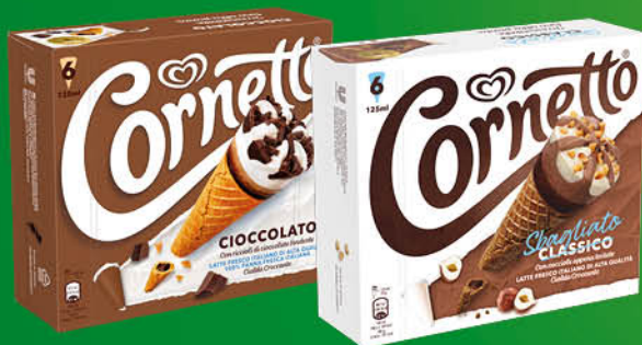
CORNETTO ALGIDA VARI GUSTI X6 GR.450