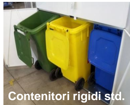
Contenitori rigidi std.

Un nuovo marketing che si traduce in un tangibile e immediato risultato: [azione Riciclo] = [risultato Ricompensa] . Questo nuovo sistema per il marketing ha un bassissimo costo contatto e genera un elevato incremento di clienti e vendite.