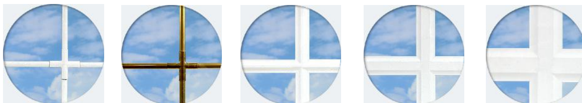
Croisillon 8 mm Croisillon 8 mm Croisillon 18 mm Croisillon 26 mm Croisillon 45 mm

Croisillons incorporés disponibles: 8mm, 18mm, 26mm, 45mm