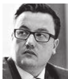
André Eberhard Research Medien AG Rheda-Wiedenbrück

Der deutsche Immobilienmarkt ist im Daueraufwind. Neueste Zahlen des Rates der Immobilienweisen zeigen, dass nahezu alle Assetklassen vom Boom profitieren. Besonders Wohnimmobilien sind weiterhin im Aufwind. Die hohe Nachfrage bei gleichzeitig niedrigen Zinsen ermöglicht auch eine günstige Situation für anstehende Sanierung von Altbeständen. Ein Beispiel aus Schwerin könnte hier Schule machen.