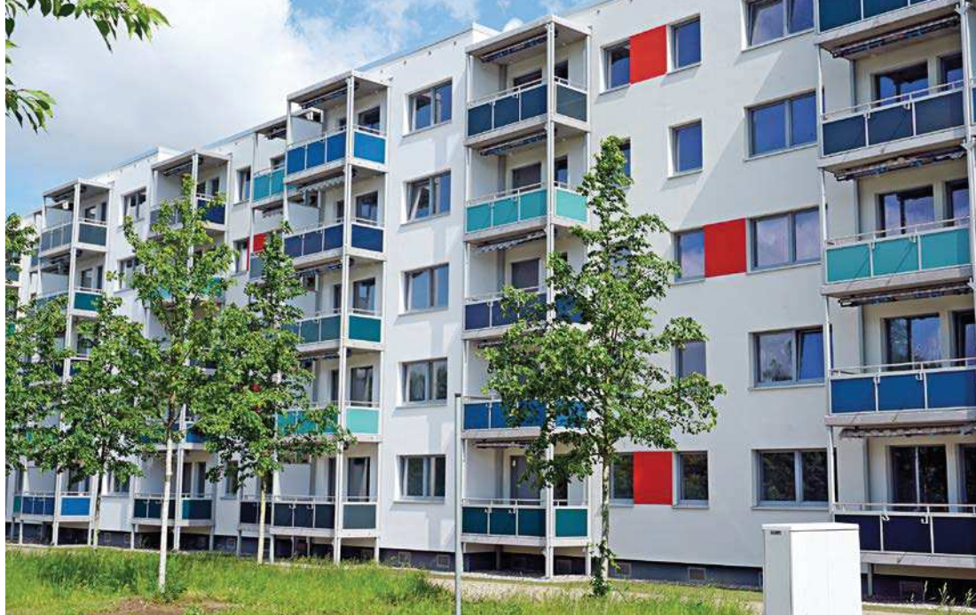
13 Monate lang wurde der 5-Geschosser in der Neubrandenburger Straße in Schwerin intensiv saniert und modernisiert. Das aus dem Jahr 1977 stammende Gebäude ist heute kaum wiederzuerkennen