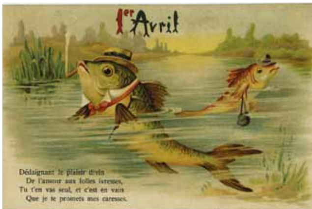
Ook hier zoekt men een grens op. Twee aangeklede vissen 'gaan' uit elkaar. In de context van 1 april is de boodschap waarschijnlijk net andersom bedoeld. Let ook op vissenmotief in de typografie van 1 er Avril.