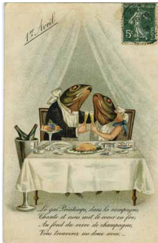
Frans, 19 e eeuwse postkaartje waarop twee vissengeliefden het glas heffen. Op de bodem van het glas valt misschien een (serieuze) betekenis te halen. Op de grens van scherts en ernst.