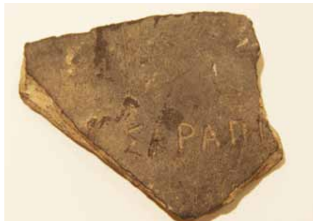
De beroemde scherf van Kontich: van mysterieus topstuk tot onvervalste fake.

In 1968 gebeurde er tijdens de archeologische opgravingen in Kontich iets heel bijzonders. 9 Op de Romeinse vicus te Kontich-Kazerne stootte opgravingsleider Felix Lauwers plots op een stuk beschreven potscherf, een ostrakon in het archeologisch jargon. Verwondering en vreugde alom. Op de scherf stond namelijk in Griekse letters ΣΑΡΑΠΙΣ gekrast: Sarapi, de naam van een Egyptische godheid. Een uniek stuk, zo dacht men. In de Nederlanden was nog nooit een dergelijke scherf met een referentie aan een Egyptische godheid gevonden. Dit unieke stuk