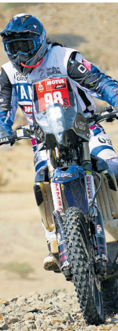
UNLIMITED MEDIA-KICO MONCADA