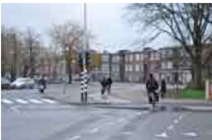
De oversteek over de Kamperfoeliestraat

Zoals tal van woon-werkfietsers dagelijks merken, betekent de herinrichting van dit kruispunt bepaald geen verbetering. De inrijhoek van het fietspad richting Weimarstraat is scherper geworden en ligt niet in het verlengde van het fietspad aan de overkant. Dat vereist nogal wat manoeuvreerwerk. Niet zo'n probleem als je langzaam rijdt en op rustige momenten, maar in de spits is het passen en meten of - zoals diverse fietsers doen - gewoon de rijbaan nemen. Ons protest tijdens de aanleg mocht helaas niet baten. De uitrit richting Loosduinen is versmald, wat ook niet bepaald fiets-