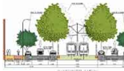
De Groot Hertoginnelaan: hoe het was en het hoe het gaat worden.