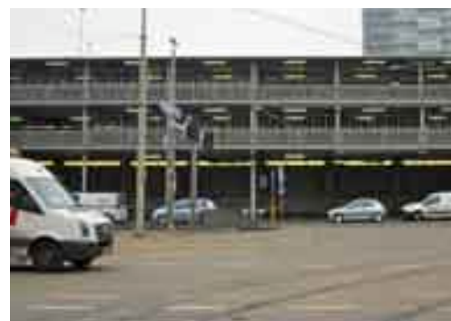
De fietsflat aan de kant van het Prins Bernhardviaduct; dit deel staat grotendeels leeg vanwege de slechte bereikbaarheid