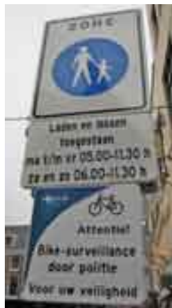
Een impressie van het bordenwoud