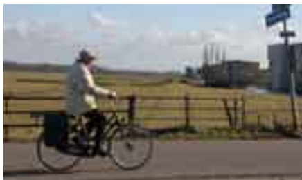
Kostverlorenweg: nieuw fietspad mogelijk

De gemeenten Wassenaar, Voor- schoten en Leidschendam-Voorburg legden deze doelstellingen neer in hun gemeenschappelijke landelijke ontwikkelingsplan (LOP) Duin, Horst en Weide. Het bijbehorende uitvoe-