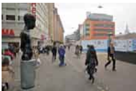
De Grote Marktstraat: geven en nemen

Het huidige fietspad maakt na de herinrichting van de Grote Marktstraat plaats voor een enigszins verdiept fietspad. Zo moet het voor