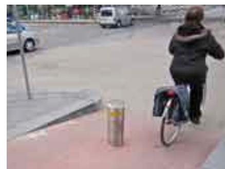
Paaltje in het wegdek bij Buza

len en vindt ons daarbij aan zijn zijde. Helpt u mee onnodige paaltjes en irritante randjes in onze regio op te sporen? Meld ze via info@fietsersbondhaagseregio.nl