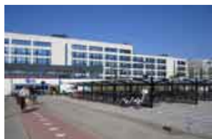
Extra plaatsen aan de Voorburgse kant

Daar blijft het tekort van circa 50 fietsparkeerplaatsen bestaan. Aan de andere kant is weliswaar ruimte, maar fietsers die hier geen vrije plaats kunnen vinden rijden daar niet naartoe. De omweg kan worden verkort door het instellen van tweerichtingenverkeer op het fietspad aan de