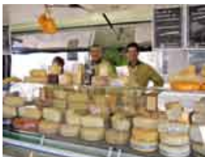
Het Cereaal, de kaaskraam op de biologische markt

verse groenten, brood, droogwaren, zuivelproducten en natuurlijk kaas.