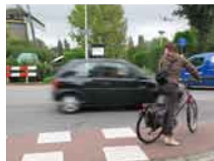
Een hachelijke oversteek bij de IJscclubweg

het Mobiliteitsplan van de gemeente en de oversteek maakt deel uit van een van de vier sterroutes. Alleen: de situatie is dermate urgent dat de aanpak naar voren gehaald moet worden. De volgende stap is dat de commissie Leefbaarheid het initiatief bespreekt en daarover advies geeft aan de raad. Het is gebruikelijk dat de commissie dan 'op locatie' vergadert. We zijn benieuwd!