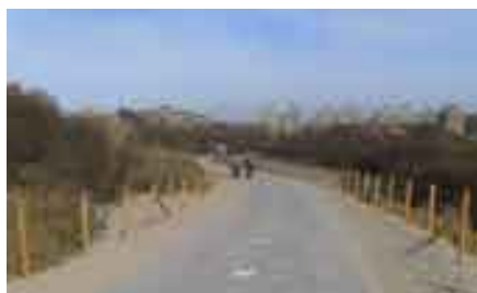
Het fietspad F370 door de duinen

Wij zijn groot voorstander van fietspaden, maar het nieuwe provinciale fietspad F370 tussen Kijkduin en Hoek van Holland (op de foto het begin hiervan) had voor ons niet gehoeven. Het fietspad wordt aangelegd op de nieuwe duinstrook, die in het kader van de kustverdediging is opgespoten. Evenals natuurverenigingen hadden wij daar liever een voetpad gezien, gecombineerd met een verbetering van het bestaande fietspad.