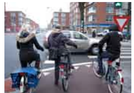
De oversteek bij Terletstraat

langs de woonboten. Wij vragen ons waarom a) het fietspad afgesloten is, b) het zo lang duurt en c) het bord 'fietsers afstappen' gebruikt wordt. Dat laatste is immers verboden in het Handboek Openbare Ruimte van de gemeente Den Haag. Fietsers die gewoon doorfietsen handelen dan ook meer in overeenstemming met de regels dan de Dienst Stadsbeheer.