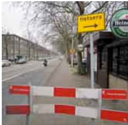
De afsluiting op de Troelstrakade

vriendelijk is. En dat allemaal in een toekomstige Sterroute.