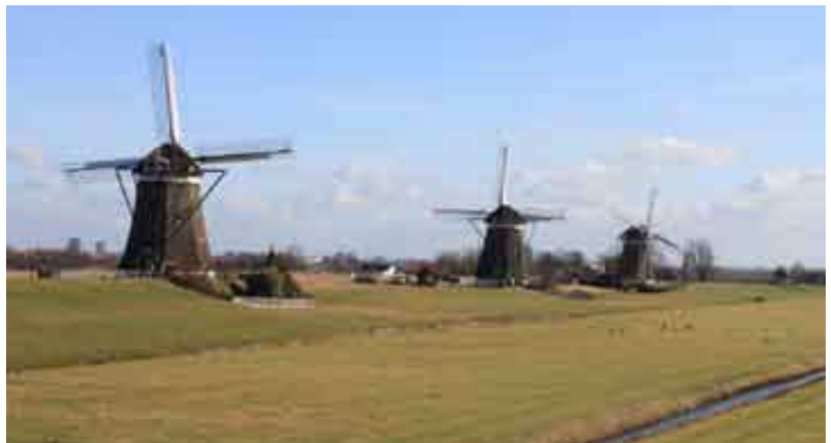
De molendriegang: wie kent hem niet? (zie het artikel op de volgende pagina)