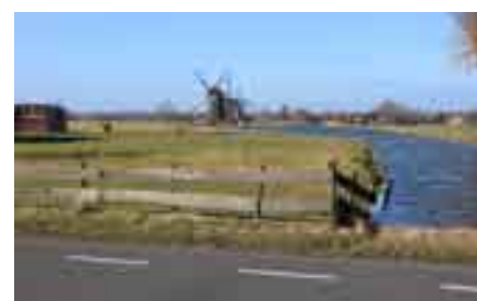
Het voet- en fietspad langs de molens

water) en de barrièrewerking verminderen (door langzaamverkeersbruggen of een (trek)pontje over de Vliet bij de Vogelplas-zuidzijde en Leidschendam-zuid).