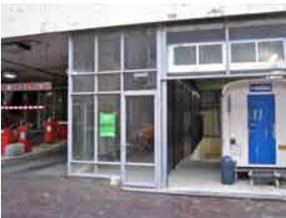
De nieuwe stalling aan De Laan. Wees er snel bij, er zijn nog enkele plaatsen!

Maar in één straat in het hart van de stad blijven de fietsverkeersborden hangen: in de Grote Marktstraat. De situatie daar wijkt volgens de gemeente af van die van de overige