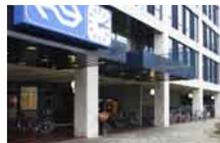
... en te weinig plaatsen aan Haagse.