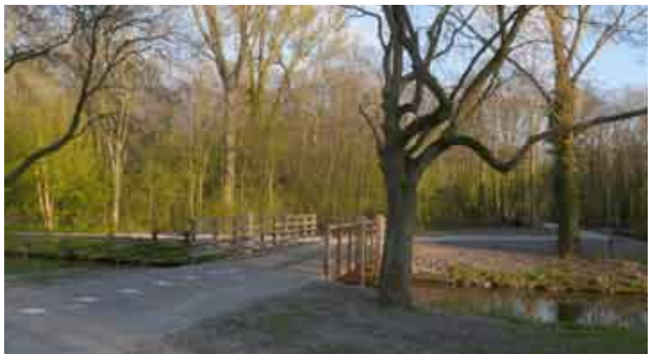
De fietsbrug naar park Overvoorde

De grens tussen Den Haag en Rijswijk loopt voor een aanzienlijk deel door de Broeksloot. Sinds eind vorig jaar is er sprake van een vernieuwde grensovergang, de brug die u op de foto ziet. Deze voert, in het verlengde van de Geysterenweg, over de Broeksloot naar park Overvoorde. De gemeente Rijswijk beschouwt de brug als 'de eerste stap naar een volwaardige fietsverbinding door park Overvoorde naar de Van Vredenburgweg'. Aan een nieuw fiets- en wandelpad wordt nu gewerkt, nadat vele tientallen bomen zijn gekapt. Medio mei moet de klus geklaard zijn en worden nieuwe bomen en struiken geplant.