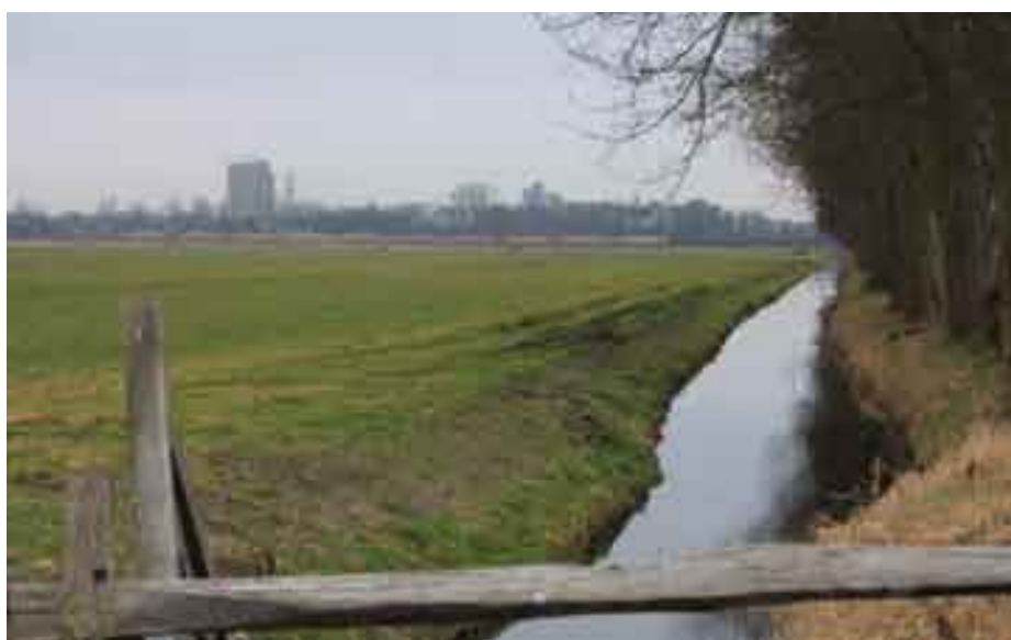
De locatie voor de dwarsverbinding aan de noordzijde van de N14

Zie voor meer informatie over het LOP Duin, Horst en Weide www.leidschendam-voorborg.nl en voor Mijn groen ons groen www.zuid-holland.nl .