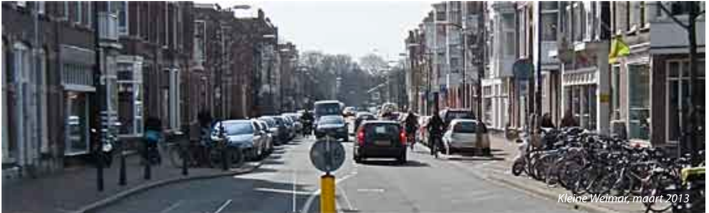
Kleine Weimar, maart 2013