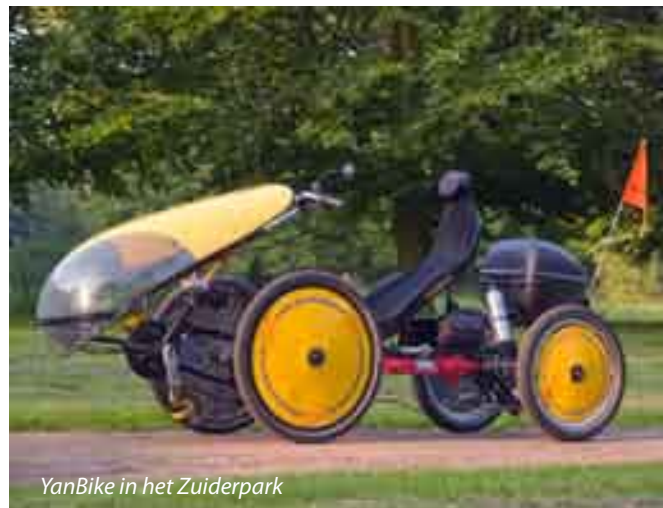
YanBike in het Zuiderpark