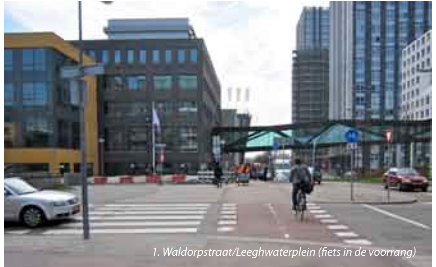
1. Waldorpstraat/Leeghwaterplein (fiets in de voorrang)

Een zelfde situatie als op foto 2, maar hier heeft de fietser wel voorrang. Echt