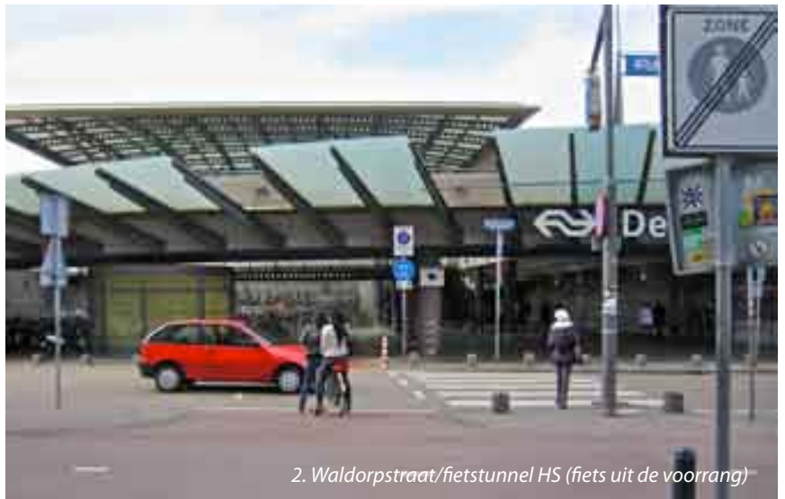
2. Waldorpstraat/fietstunnel HS (fiets uit de voorrang)

veilig is dit niet: te onopvallend voor de automobilist, niet liggend op een plateau en de trottoirbanden zijn niet genoeg verlaagd.