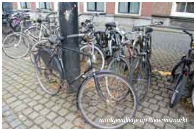
randgevalletje op Riviervismarkt

sommige fietsbeugels bezet houden. Zoals de beugels aan de Riviervismarkt op de foto, waar de fiets tegen de bovenleidingsmast al minimaal een half jaar staat.