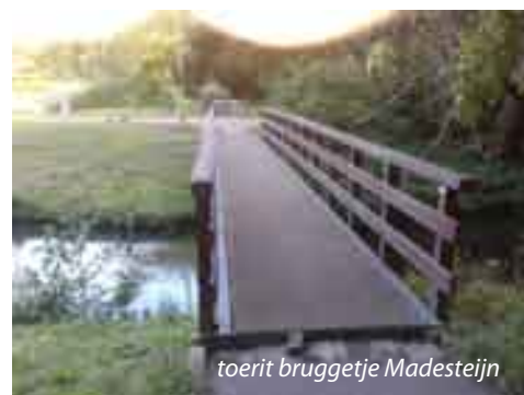
toerit bruggetje Madesteijn