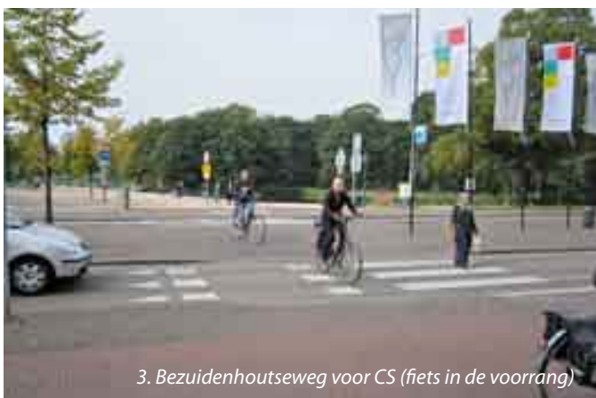
3. Bezuidenhoutseweg voor CS (fiets in de voorrang)