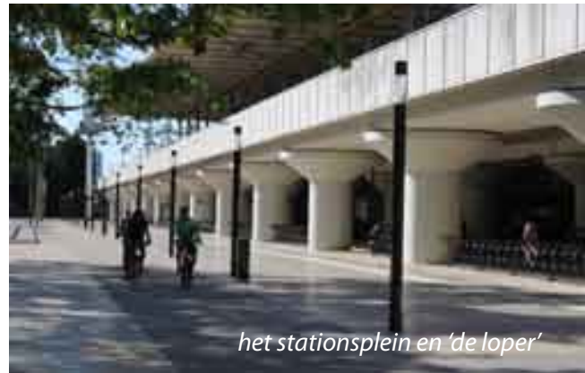
het stationsplein en 'de loper'

Dit zorgt ervoor dat de voorrang voor fietsers onduidelijk is. Daarom is de rotonde enkelstrooks gemaakt. Hiervoor zijn de linksafstrook richting de Potgieterlaan en de keerstrook richting Den Haag opgeheven door middel van brede verdrijfvlakken. Dit verduidelijkt de voorrang van fietsers en verlaagt de snelheid van het autoverkeer.