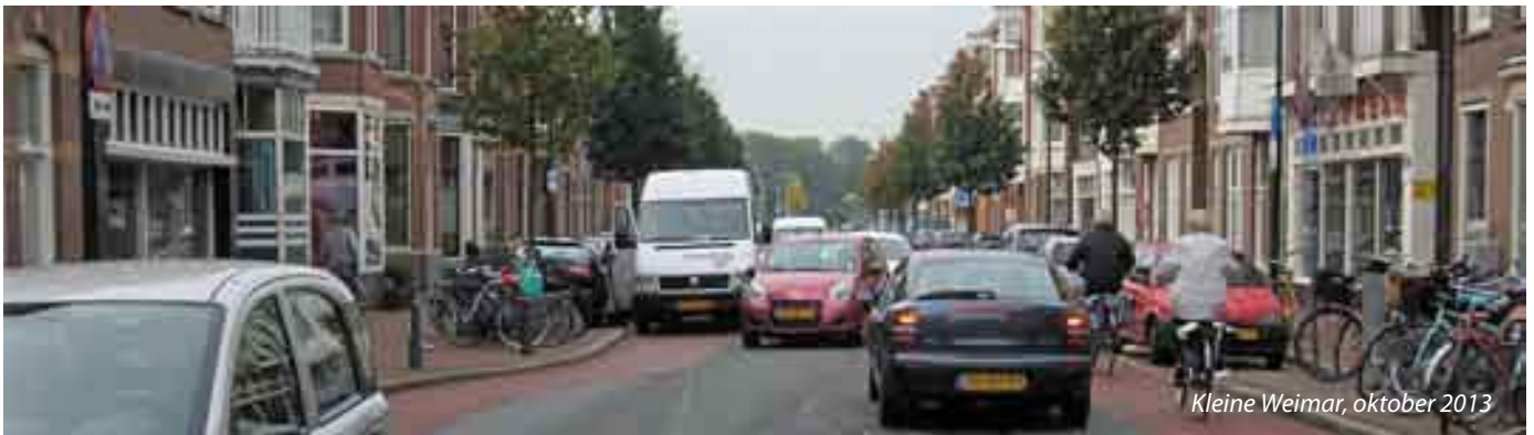
Kleine Weimar, oktober 2013

De gemeente Den Haag heeft de Weimarstraat tussen de Valkenboslaan en Valkenboskade opnieuw ingericht. Aanleiding is een dodelijk ongeval dat daar vorig jaar plaatsvond. Maar is de straat nu veiliger geworden voor fietsers?