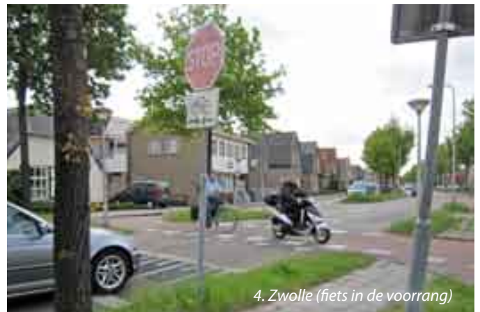
4. Zwolle (fiets in de voorrang)