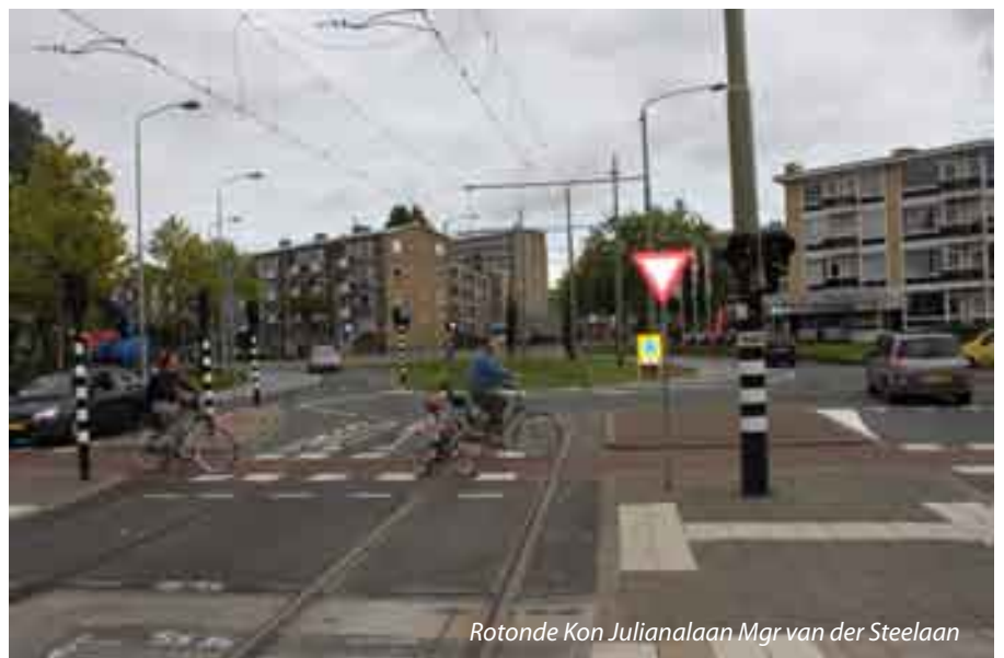
Rotonde Kon Julianalaan Mgr van der Steelaan