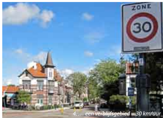
4. ... een verblijfsgebied = 30 km/uur