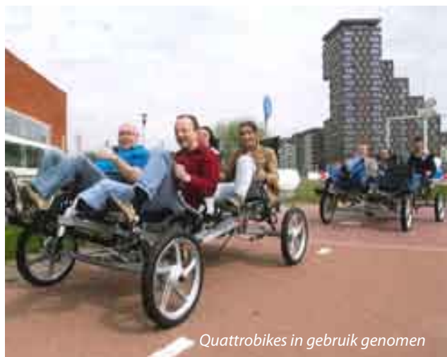
Quattrobikes in gebruik genomen