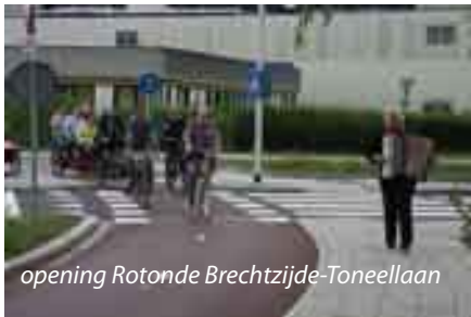
opening Rotonde Brechtzijde-Toneellaan

Voor zowel de gemeente Zoetermeer als de afdeling van Fietsersbond is dit een teleurstelling. De gemeente heeft de afgelopen jaren samen met diverse lokale belangenorganisaties veel werk verzet om het fietsklimaat te verbeteren. Het asfalteringsplan, Actieplan Fiets en het Actieplan Verkeersveiligheid zijn hier mooie voorbeelden van. Kort geleden is de rotonde Brechtzijde-Toneellaan in gebruik genomen. Hoewel nog niet optimaal,