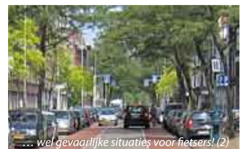
... wel gevaarlijke situaties voor fietsers! (2)