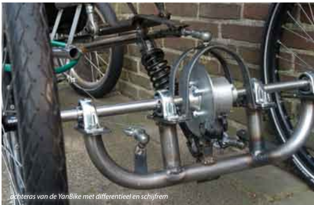
achteras van de YanBike met differentieel en schijfrem