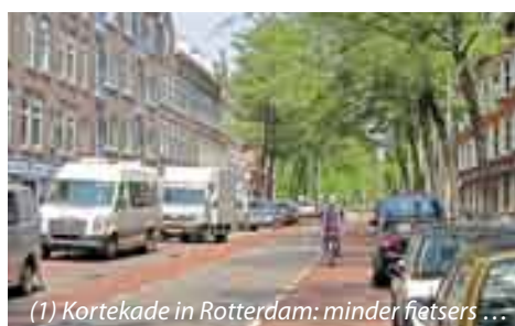
(1) Kortekade in Rotterdam: minder fietsers ...

De herinrichting is voortgekomen uit een burgerinitiatief naar aanleiding van de eerder genoemde dodelijke aanrijding. Dit initiatief ondersteunden wij volmondig, want over de fietsveiligheid in de "Kleine Weimar" hadden we tal van klachten ontvangen. Burgemeester en Wethouders schreven de gemeenteraad in december 2012 een brief met daarin onder meer deze passage: 'Het college stelt voor om een interactief proces in te zetten met bewoners, politie en andere belanghebbenden.' Gezien de hoeveelheid fietsers die dagelijks door de straat rijden, gingen wij er als belang-