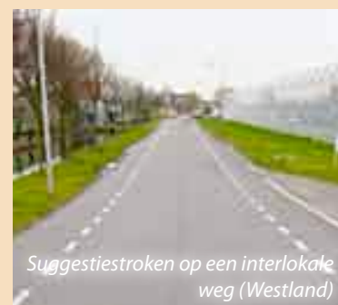
Suggestiestroken op een interlokale weg (Westland)

Een suggestiestrook is geen fietsvoorziening. Deze strook is jaren terug ontstaan. Op interlokale wegen met een breedte van vier of zes meter werd vaak te hard gereden. Daarom lieten diverse overheden een belijning aanbrengen om de weg smaller te doen lijken (zie foto). Daardoor zouden automobilisten hun snelheid matigen, was het idee. De belijning suggereert dat er sprake is van fietsstroken, vandaar de naam suggestiestroken of fietssuggestiestroken. Om verwarring met een fietsstrook te voorkomen, bevelen de verkeershandboeken aan suggestiestroken niet rood te maken.