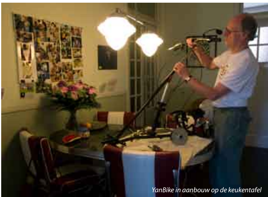
YanBike in aanbouw op de keukentafel

Van Zelderen heeft verder geen vragen of aansporing nodig. 'Zo kwam ik in contact met "Blijf Veilig Mobiel". Gehandicapten die in beweging willen blijven, daar zet ik me voor in. Ik sta op beurzen, werk samen met indexingsartsen. Mensen vragen me: