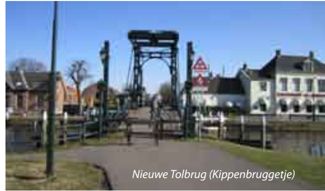
Nieuwe Tolbrug (Kippenbruggetje)

De rotonde bij de kruising van de hoofdfietsroutes Mgr. van Steelaan en Kon. Julianalaan wijkt door zijn langgerekte, gebogen vorm, de trambaan in het midden en de indeling met dubbele rijstroken, af van de standaard inrichting.