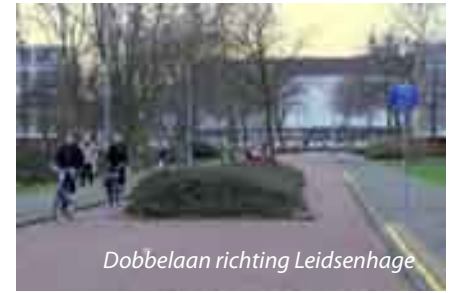
Dobbelaan richting Leidsenhage

de Prinsensingel sluit de fietsroute aan op Prinsenhof.