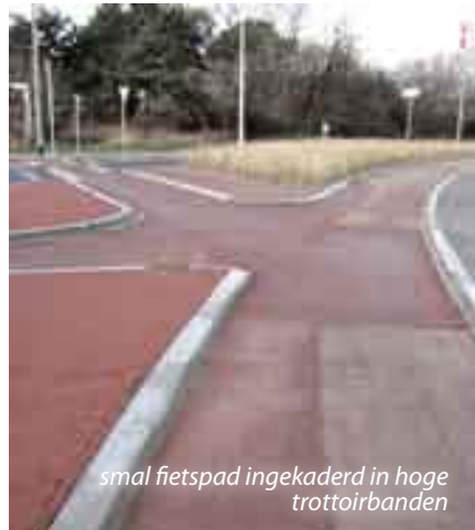
smal fietspad ingekaderd in hoge trottoirbanden