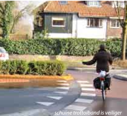
schuine trottoirband is veiliger