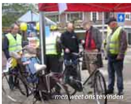
men weet ons te vinden

Op 2 november hebben we voor de derde keer een fietsverlichtingsactie georganiseerd.