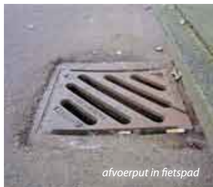
afvoerput in fietspad

eigen technische eis voor de breedte van een fietspad, dan kan men net zo goed de toegenomen onveiligheid die daardoor ontstaat verminderen met overrijdbare randjes. Dat propageert de Fietsersbond al jaren. Wanneer een