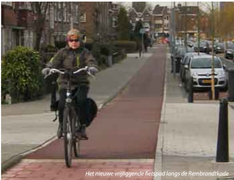
Het nieuwe vrijliggende fietspad langs de Rembrandtkade

oplossingen crypto-filippine vorige nummer: A zwartrijder B een tandje extra C venttelslang D groene golf E het stuur omgooien F bocht G klappand H spakenstentel