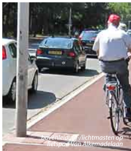
bovenleiding-/lichtmasten op fietspad Van Alkemadelaan