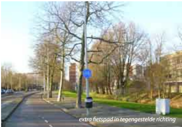
extra fietspad in tegengestelde richting

Begin jaren tachtig werd een start gemaakt met het samenvoegen van scholen. Daardoor werd de efficiency