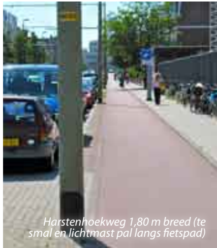
Harstenhoekweg 1,80 m breed (te smal en lichtmast pal langs fietspad)

Wij hebben de indruk dat eerst de andere verkeersdeelnemers, inclusief de geparkeerde auto, een plek krijgen bij de inrichting en dat de fietser het moet doen met de ruimte die nog over is. Je zou toch zeggen dat een kwets-