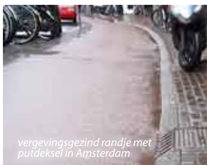
vergevingsgesond randje met putdeksel in Amsterdam

Tussen het fiets- en het voetpad wordt als regel een opstaande rand aangebracht met een hoogte van \pm 5 cm.