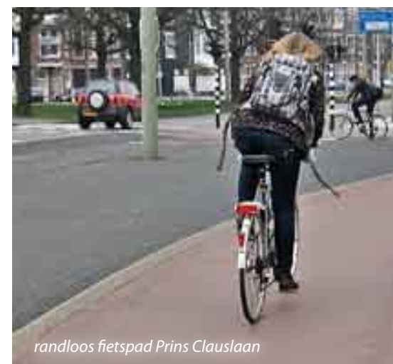
randloos fietspad Prins Clauslaan