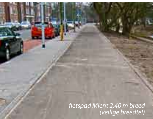
fietspad Mient 2,40 m breed (veilige breedte!)

Maar er blijven andere zorgen. Gemiddeld zijn de fietspaden in Den Haag aan de smalle kant. Bij het inrichten van een straat maakt de gemeente Den Haag gebruik van een door haar zelf opgesteld Handboek Openbare Ruimte (HOR). In dat Handboek staat als technische eis dat een fietspad een breedte moet hebben van 2,40 m. Deze breedte is over het algemeen voldoende om veilig en comfortabel te kunnen fietsen. Fietsers moeten met twee naast elkaar kunnen fietsen. Dat is niet alleen prettig en gezellig, maar vaak ook noodzaak. Neem een ouder die zijn of haar kind op de fiets begeleidt naar bijvoorbeeld school.