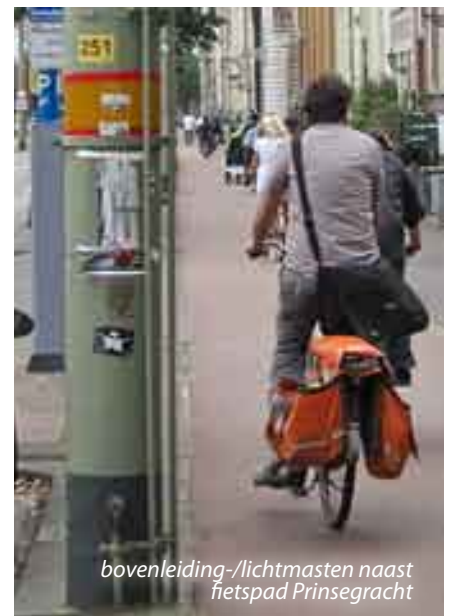
bovenleiding-/lichtmasten naast fietspad Prinsegracht