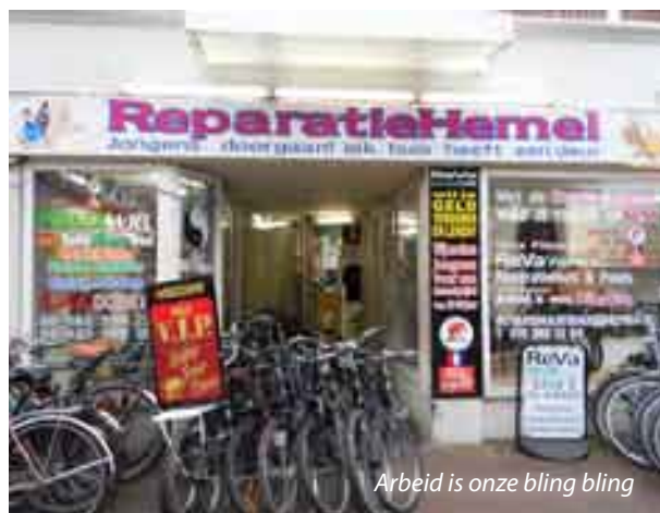
Arbeid is onze bling bling

Voor de fietsenmaker is belangrijk is dat mensen hun dromen najagen, dat ze ergens passie voor hebben. Op mijn vraag of er nog iets is wat hij aan de lezer kwijt wil: Het is vooral belangrijk dat jongeren hun opleiding afmaken! Hij is er trots op dat het bedrijf er-