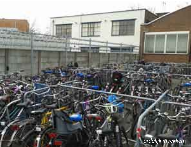
ordelijk in rekken

merk van de fabrikant) en zeven cijfers. Vervolgens worden de fietsen opgeslagen. Dat gaat per locatie waar ze vandaan komen, netjes in de vakken. Bij het Fietsdepot gebruiken ze het principe van de slang: aan de kop komen de net binnen gekomen fietsen erbij, aan de staart verdwijnen de fietsen wanneer hun termijn er op zit. Het afscheid kan op drie manieren. Fietsen die in zeer beroerde staat zijn, worden vernietigd. Annemiek: