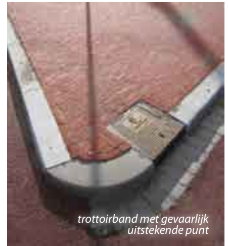
trottoirband met gevaarlijk uitstekende punt

eigen technische eis voor de breedte van een fietspad, dan kan men net zo goed de toegenomen onveiligheid die daardoor ontstaat verminderen met overrijdbare randjes. Dat propageert de Fietsersbond al jaren. Wanneer een