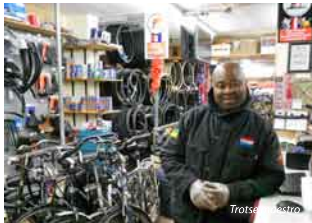
Trots op de meester