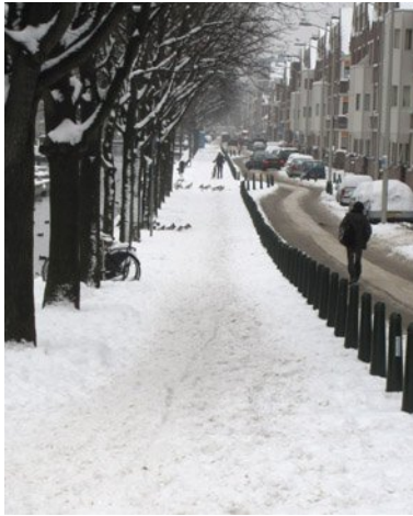
De Noordwal op 22 december...