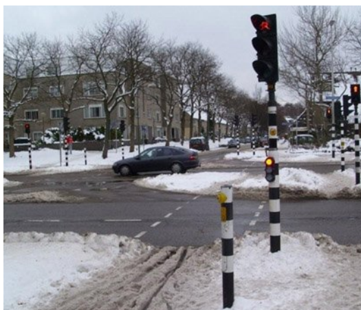
De kruising Houtwijklaan/Berlagelaan, januari 2011