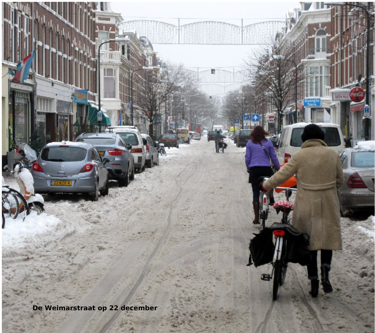
De Weimarstraat op 22 december