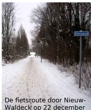
De fietsroute door Nieuw-Waldeck op 22 december

De Fietsersbond heeft een paar aandachtspunten en aanbevelingen voor een eventuele nieuwe sneeuwperiode.