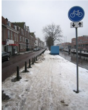
... en - in tegengestelde richting gezien - op 29 (!) december

De tweede helft van december was een moeilijke periode. Wij hebben de indruk dat de gemeentevooral de fietsers en voetgangers weer behoorlijk in de kou heeft laten staan.