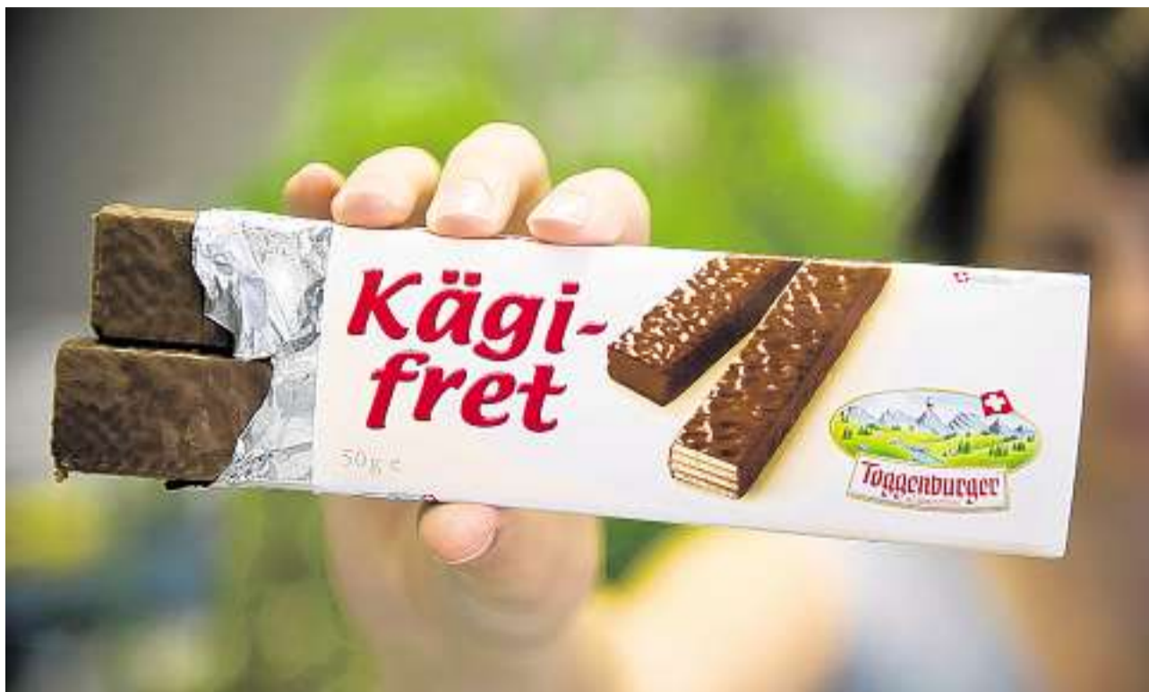
Exportschlager: Kägi-fret ist ein international beliebter Snack für zwischendurch – und das schon seit mehr als einem halben Jahrhundert.