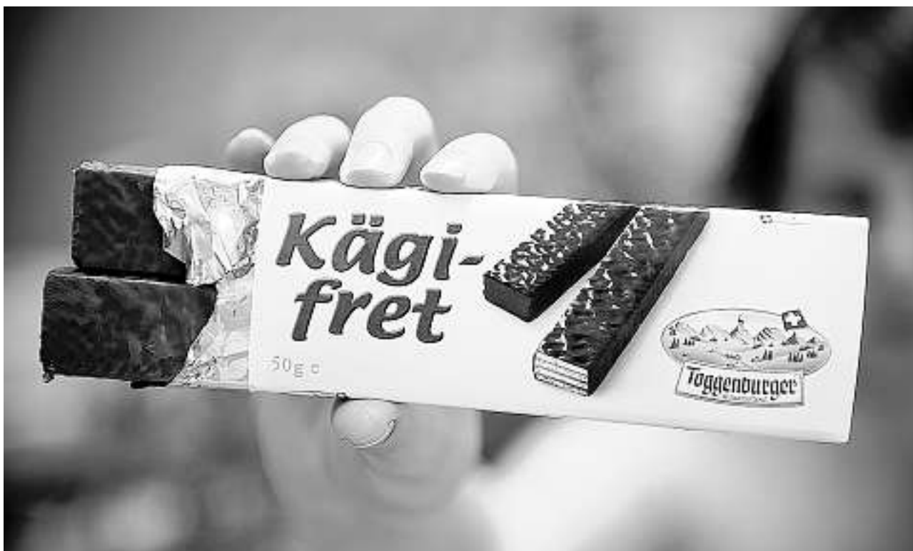
Exportschlager: Kägi-fret ist ein international beliebter Snack für zwischendurch – und das schon seit mehr als einem halben Jahrhundert.