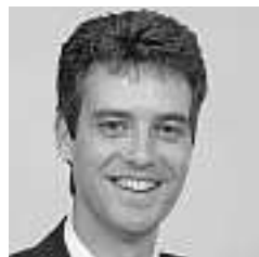
Von Roman Schuler*

Der Swiss Market Index (SMI; gegenüber der Vorwoche +1,9 Prozent auf 6232,99 Punkte) gewann am Montag ein Prozent und knüpfte damit an die Gewinne von letzter Woche an. Geprägt wurde das Geschehen an der Börse am Donnerstag und gestern von mehrheitlich positiven Konjunkturdaten aus den USA. So stieg die Konsumentenstimmung stärker als erwartet, und die Arbeitslosenzahlen waren weniger schlecht als vorausgesehen.