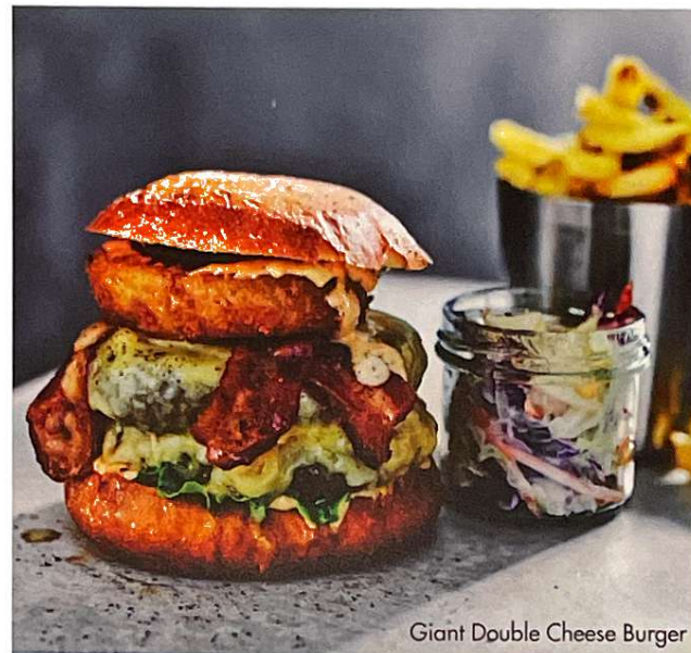
Giant Double Cheese Burger