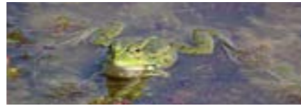
Kindergarten, Primarschule, April bis Oktober