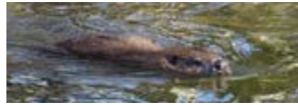
Kindergarten, Primarschule, ganzjährig