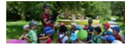
Alle Altersstufen, April bis Oktober