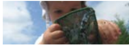
Kindergarten, Primarschule, April bis Oktober