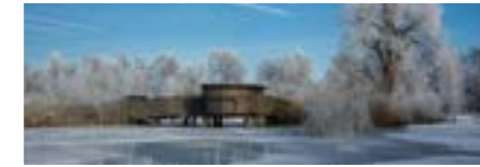
Alle Altersstufen, Winter