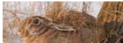
Kindergarten, Primarschule, Winter