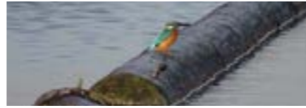
Kindergarten, Primarschule, ganzjährig

Infoveranstaltungen für Lehrpersonen finden nach Bedarf statt und sind kostenlos. Nehmen Sie mit uns Kontakt auf, wenn Sie an der nächsten Veranstaltung teilnehmen möchten.