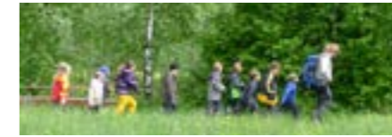
Alle Altersstufen, ganzjährig