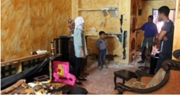
عائلة تُعاين الدمار الذي خلفه الجنود في بيتها بمُخيم بلاطة لللاجئين، 17.6.2014.

ويُمكن لهذه السياسة أن تصل حدَّ انتهاك الحظر القائم في القانون الدولي على ممارسة العقوبات الجماعية (أي معاقبة شخص أو مجموعة جراء مخالفة لم يرتكبوها بأنفسهم)، وعلى استخدام وسيلة التخويف والترهيب تجاه الخاضعين للاحتلال. يُضاف إلى ذلك أن سياسة اقتحام البيوت لغاية الردع تناقض تمامًا تأويلات الصليب الأحمر لاتفاقية جنيف، التي توضح حظر استخدام وسيلة التخويف بغية ردع المشاركة في مقاومة السلطة العسكرية.