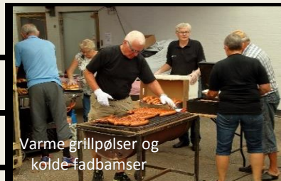
Varme grillpølser og køllefadbamser

Deltagelse koster kun 100 kr pr. køretøj, motorgruppe eller kræmmerbod; der betales ved ankomst til pladsen. Børneboder er GRATIS. I prisen er inkluderet spisebillet til føreren. Ved indskrivning udleveres skilt, spisebillet og stemmeseddel + sponsorgaver så længe de rækker.