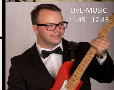
LIVE-MUSIC 11.45 - 12.45