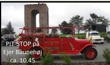
PIT-STOP på Ejer Baunehøj ca. 10.45

På pladsen ved "Hos Købmanden", Hylkevej 52 8660 Skanderborg