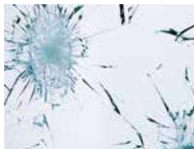
Vitrage feuilleté : en cas de choc, ne se brise pas, le vitrage reste entier bien que fissuré (ex : le pare-brise de votre voiture)