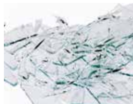
Vitrage classique : en cas de choc, se brise et risque de blesser les personnes.