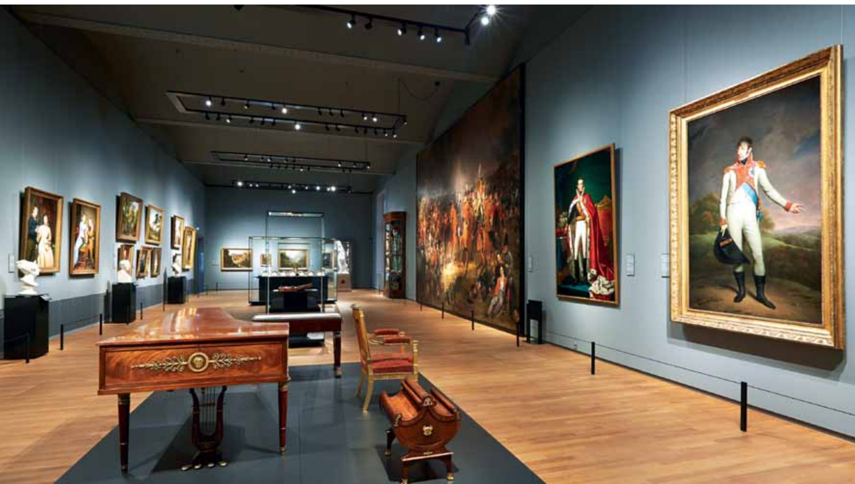
Rijksmuseum blander kunst og andre gjenstander, som her i et av 1700-tallsgalleriene. Dermed forteller de historien på en annerledes og engasjerende måte.

I april åpnet Rijksmuseum i Amsterdam dørene for et gjensyn med Rembrandt, Vermeer, van Gogh og alle de andre, verdensberømte nederlandske kunstnerne. Da var det ti år siden bygget ble stengt, og grunnen til at renoveringen har tatt fem år mer enn ventet ligger i de omfattende endringene som er gjort. Samtidig er Pierre Cuypers' opprinnelige arkitektur anno 1885 vel ivarett.