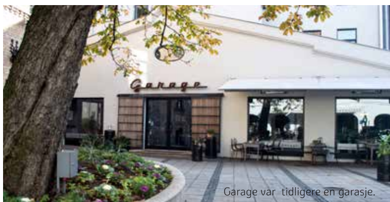
Garage var tidligere en garasje.