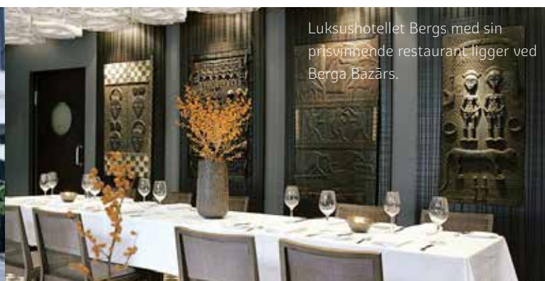
Luksushotellet Bergs med sin prisvinnende restaurant ligger ved Berga Bazārs.