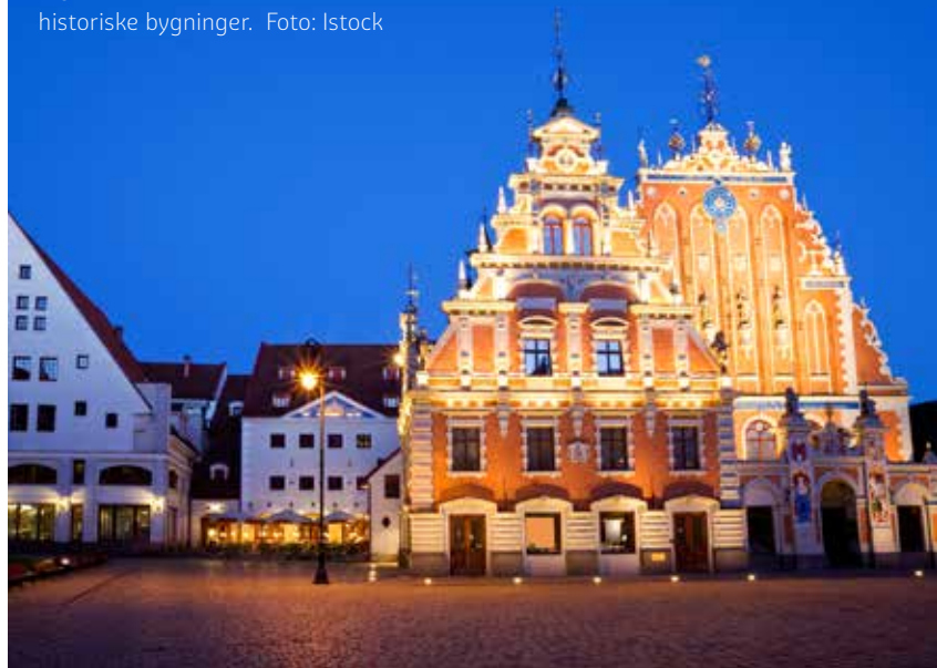
Rigas sentrum er fullt av vakre, historiske bygninger.