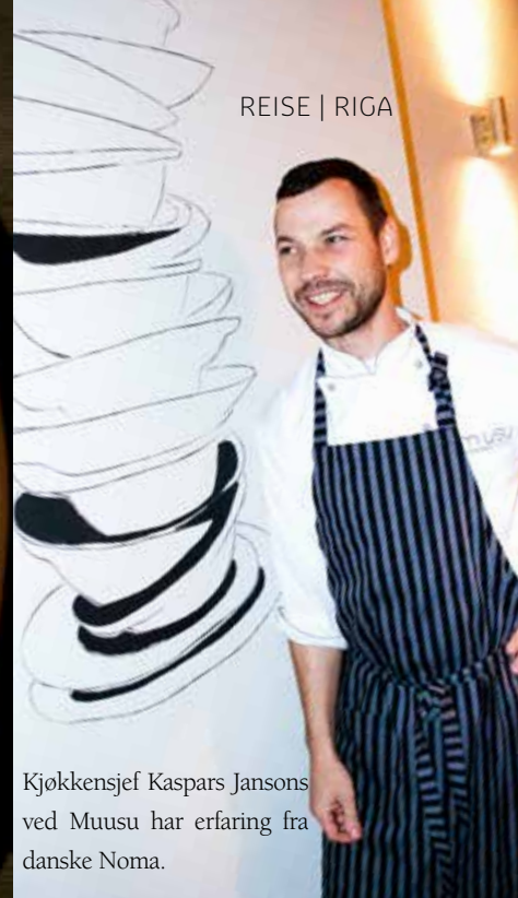
REISE | RIGA