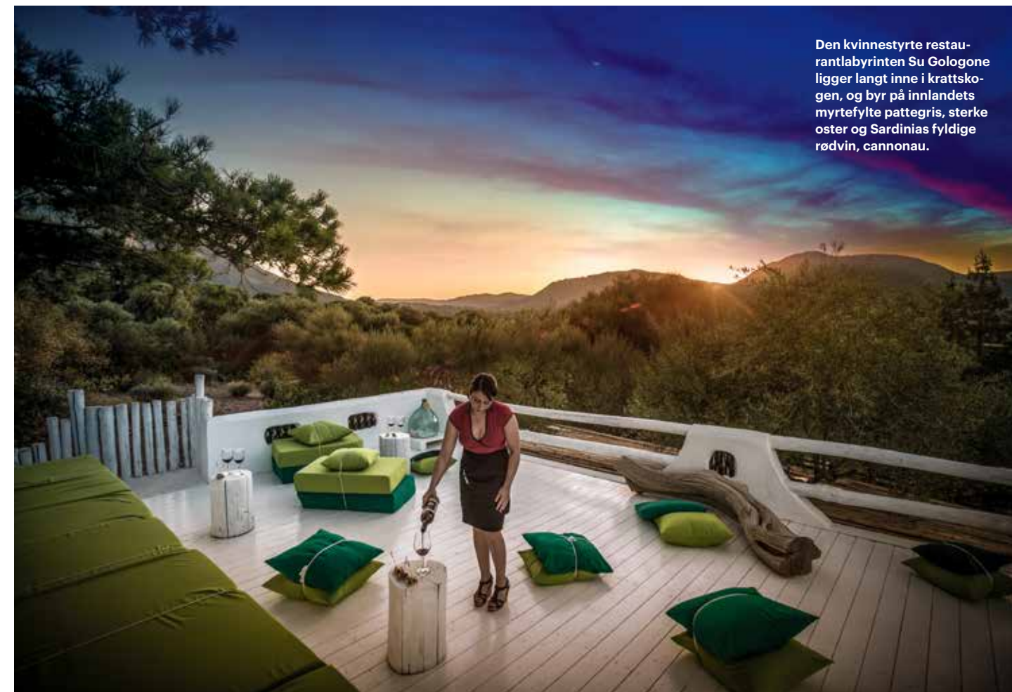
Den kvinnestyrt restaurantlabyrinth Su Gologone ligger langt inne i krattskogen, og byr på innlandets myrtefylte pattedgris, sterke oster og Sardinias fylldige rødvin, cannonau.