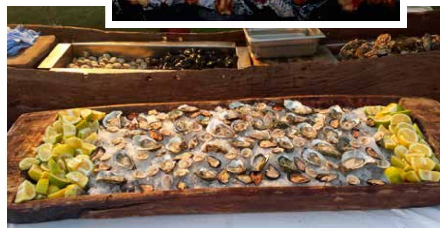
Sardernes gastronomiske repertoar er eldgammelt med elementer fra både hav og innland.

dinsk gastronomi. De har nylig flyttet fra Sardinia til Sverige. I Värmland holder de kokkekurs og importerer sardinske delikatesser. De reiser minst én gang i året til Sardinia, der de besøker sine leverandører og tar seg tid til strender og samvær med familie og venner.