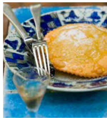
Durumhvete og honning er noen av ingrediensene som sardene vet å foredle i brød, pasta og kaker.