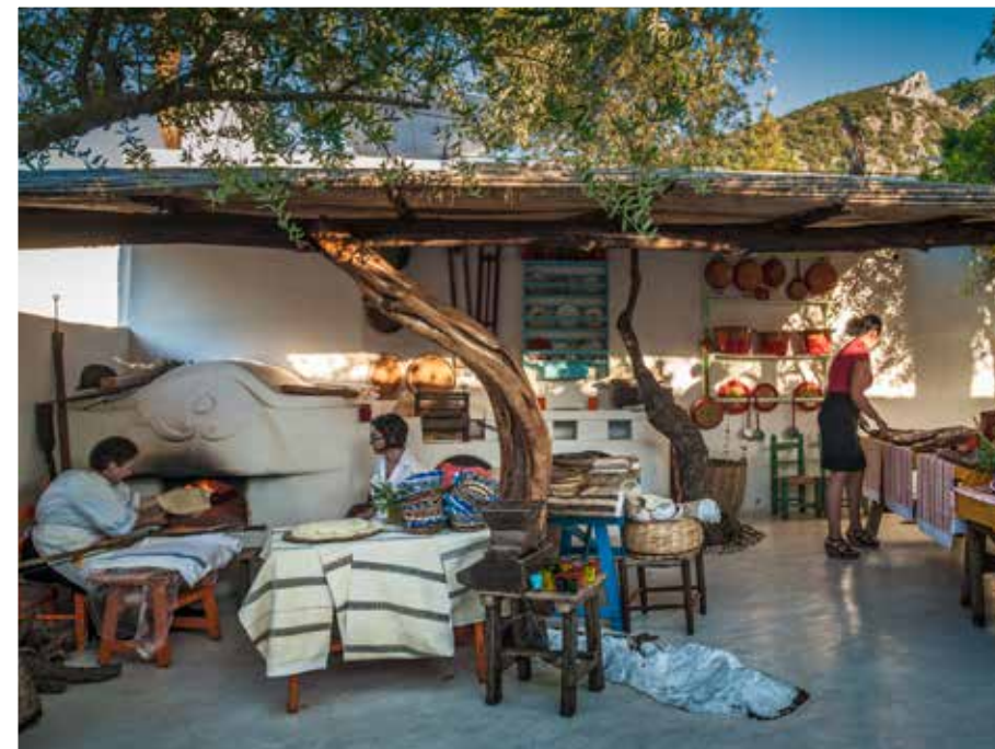
Hos Su Gologone kan gjestene delta på matlagingskurs basert på eldgamle sardiniske tradisjoner.

Full innlandsmeny med forrett, hovedrett og dessert varierer mellom 40 og 80 euro på Su Gologone. Drikken kommer utenom. Mye god vin. De unike hotellrommene koster mellom 150 og 250 euro per natt, frokost inkludert, utenom høysesongen. I august begynner prisene omtrent der de slutter ellers i året (sugologone.it/en).