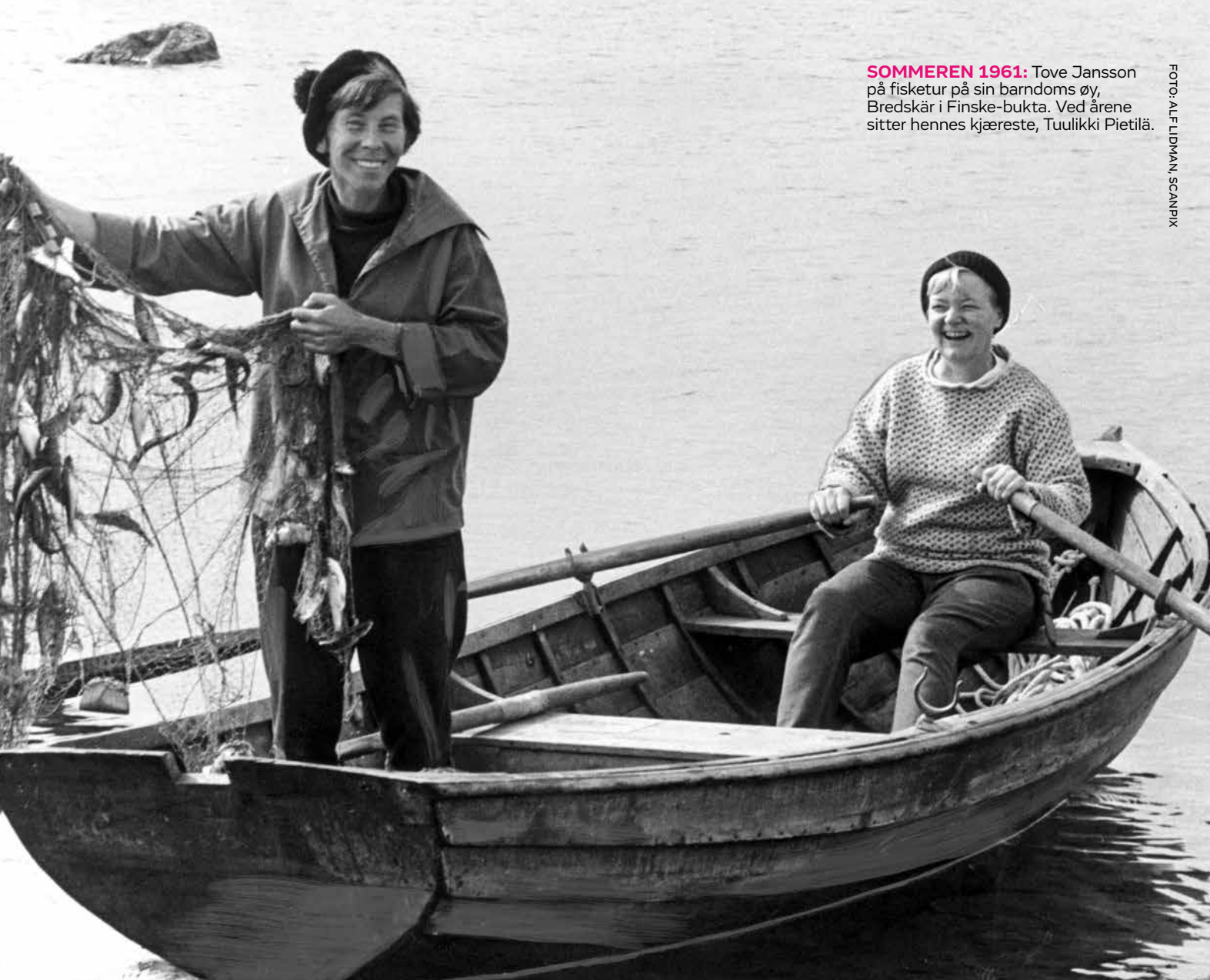
SOMMEREN 1961: Tove Jansson på fisketur på sin barndoms øy, Bredskär i Finske-bukta. Ved årene sitter hennes kjæreste, Tuulikki Pietilä.